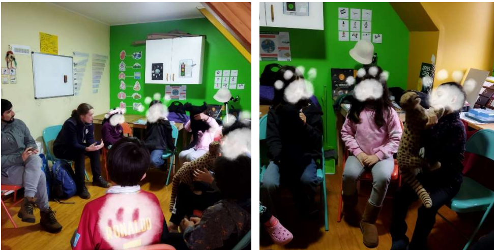
Educación ambiental sobre el rol ecológico del gato güiña. También llevamos al ratón de fieltro, pero no se aprecia en la foto.