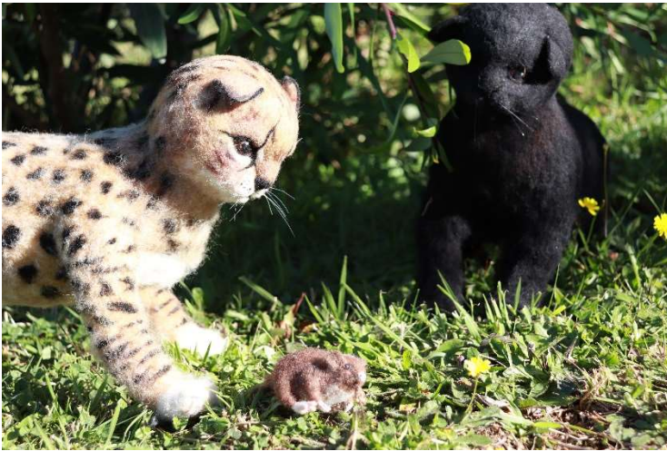
Güiñas y ratón collargo que usamos en nuestras actividades de educación ambiental.