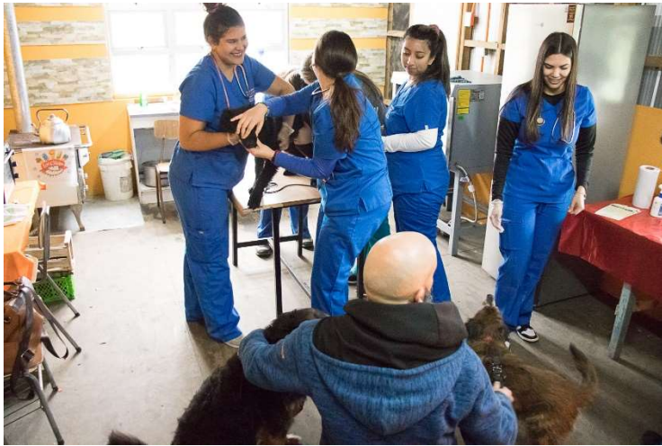
Equipo estudiantil de la Universidad Santo Tomás en la Jornada de Vacunación y Desparasitación en Colonia Tres Puentes.