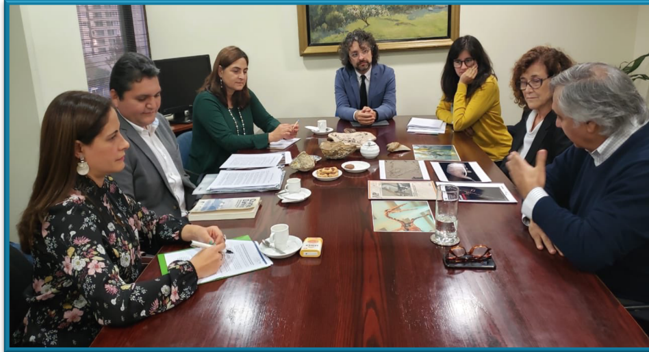
Reunión de representantes de la región con la Presidenta del Consejo de Defensa del Estado.