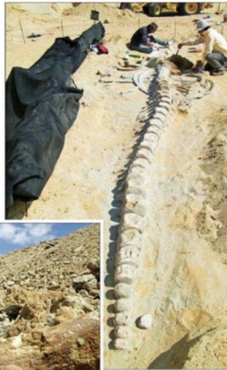
Cerro Ballena ha sido un lugar privilegiado para encontrar restos fosilizados de estos animales, como se ve en la foto.