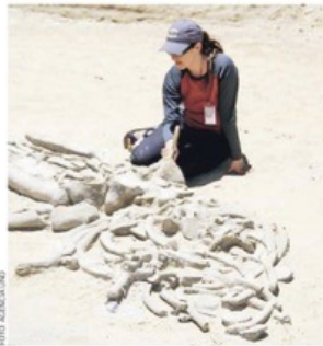
► Excavaciones en el parque.

Consejo de Defensa del Estado y autoridades locales sellaron un acuerdo para resguardar un área geográfica de más de 2.500 hectáreas, donde se han encontrado milenarios fósiles.