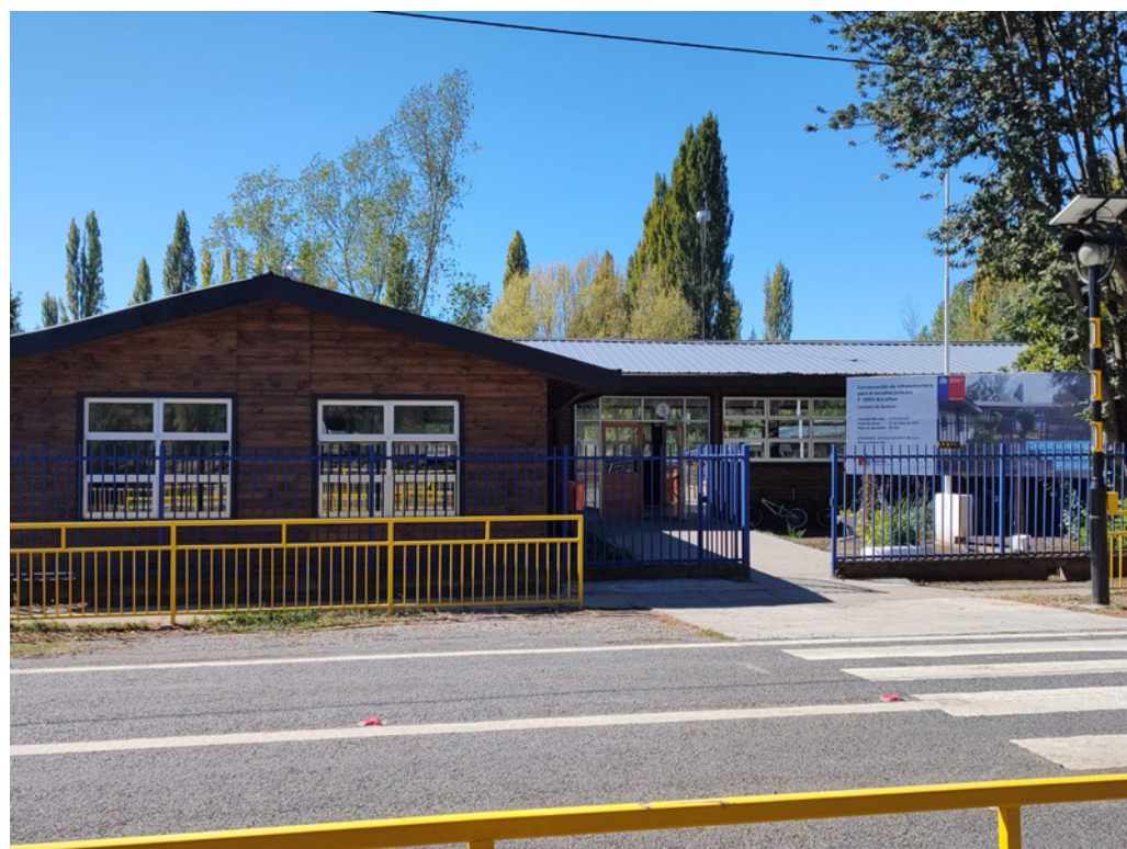
IMAGEN REFERENCIAL DE UN ESTABLECIMIENTO DE LA PROVINCIA DEL BIOBIO

DURANTE EL AÑO 2022 NOS ENFOCAMOS EN EXPLORAR PROBLEMATICAS PARA EL DISEÑO Y POSTERIOR BÚSQUEDA DE FONDOS CON ENFASIS EN ENTREGAR APOYO A LAS COMUNIDADES EN DIMENSION SOCIOEMOCIONAL DE NIÑAS NIÑOS Y ADOLECENTES.