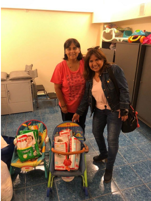
Recepción y entrega de donaciones