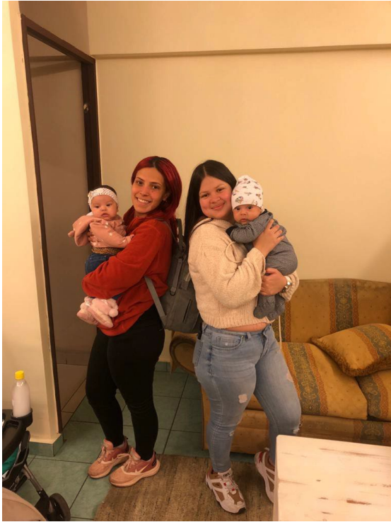
Capacitaciones personales a nuestras usuarias y sus bebés