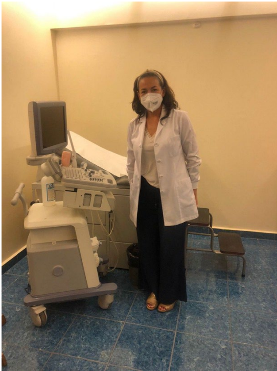
Nuestra ginecóloga haciendo Ecografías de confirmación