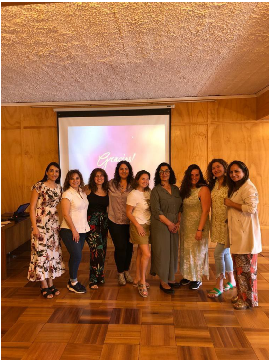
Capacitaciones de las Voluntarias