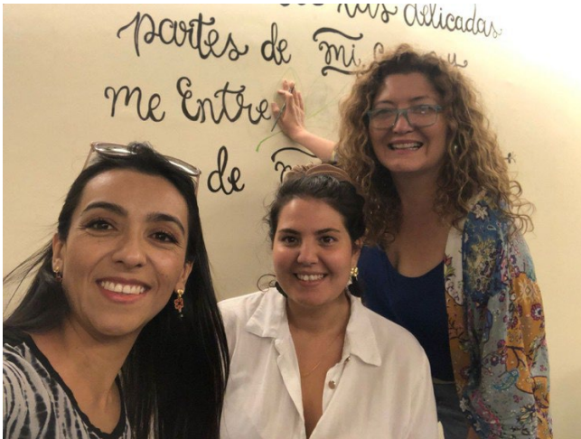
Días de voluntariado