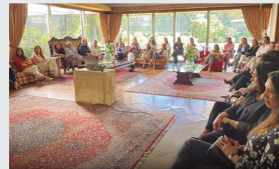
REUNIÓN CON SEÑORAS QUE SUS MARIDOS HAN SIDO NOMBRADOS CON MANDO DE UNIDAD Y AGREGADURÍAS EN EL EXTRANJERO