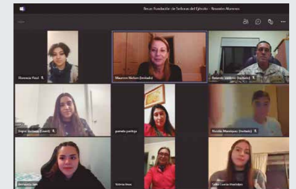
VIDEOLLAMADA DE PRESIDENTA DE LA FUNDACIÓN Y ALUMNOS BENEFICIADOS CON LA BECA.