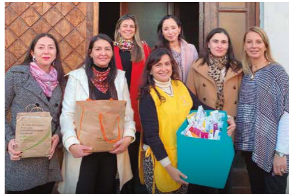
DESDE VALDIVIA ENVIARON DONACIÓN PARA EL BOTIQUÍN DEL HOSMIL