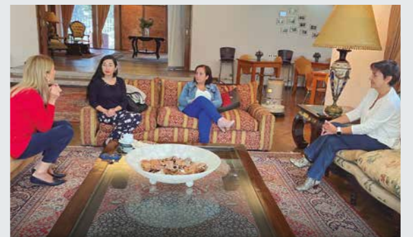
REUNIÓN SEÑORAS DE SUBOFICIALES MAYORES