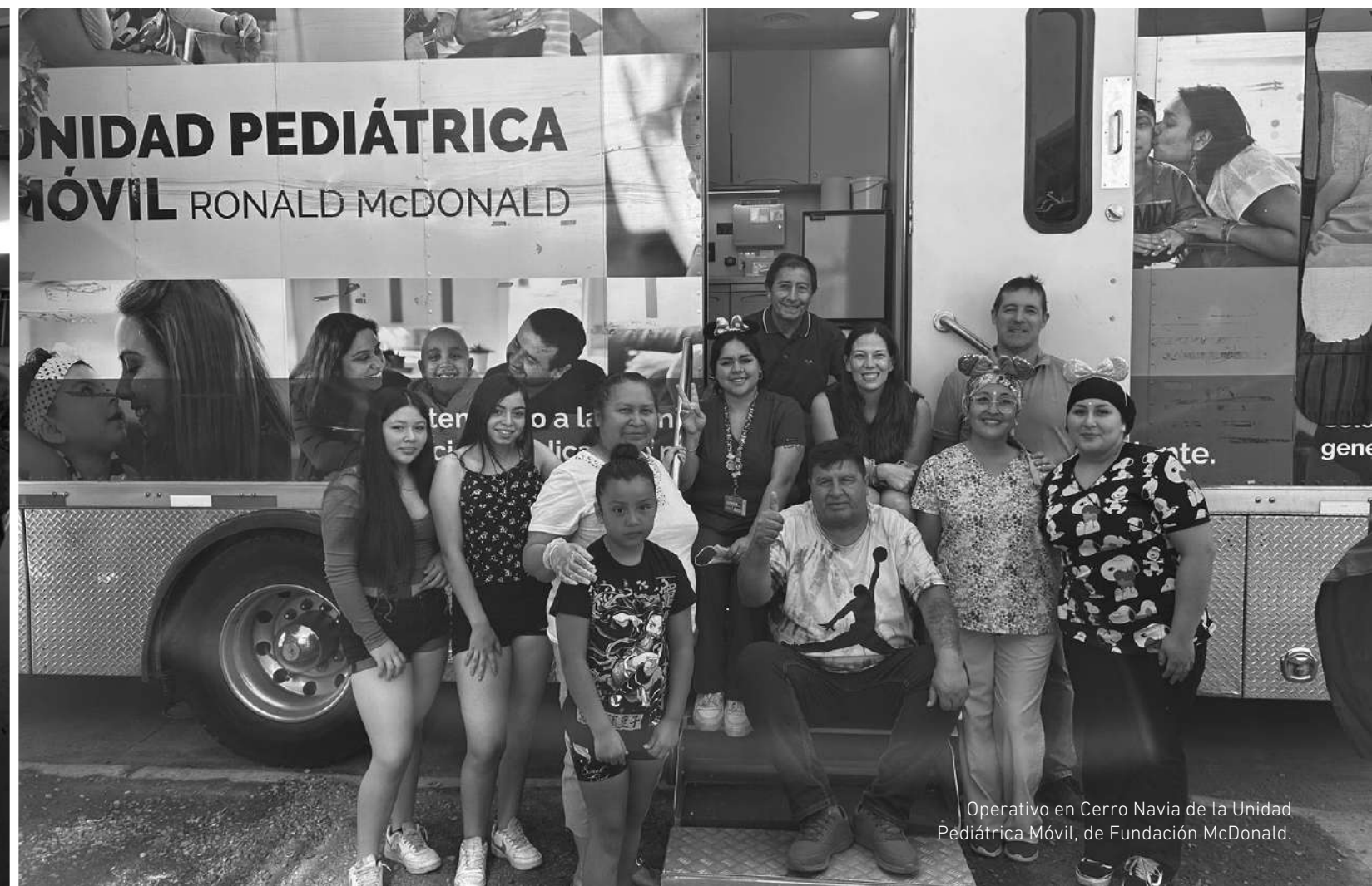
Operativo en Cerro Navia de la Unidad Pediátrica Móvil, de Fundación McDonald.