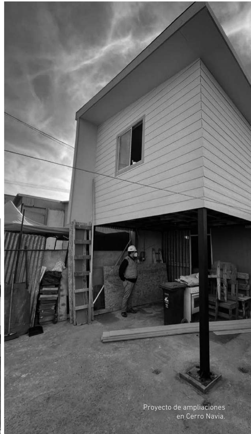
Proyecto de ampliaciones en Cerro Navia.

El siguiente proyecto se realizó en Cerro Navia, en la Villa Bicentenario . Ahí se seleccionaron a 25 familias entre las que presentaban mayores problemas de hacinamiento. Los trabajos consistieron en la ampliación del tercer dormitorio de la casa, en un segundo piso.