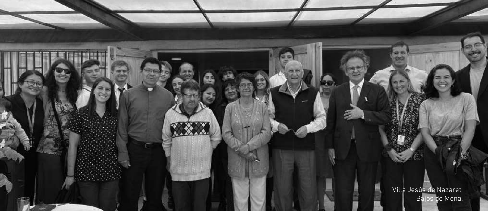
Villa Jesús de Nazaret, Bajos de Mena.