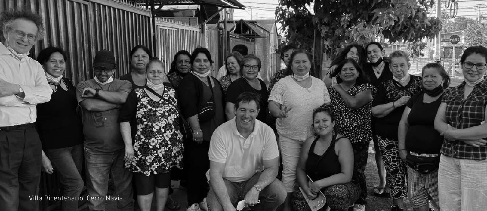
Villa Bicentenario, Cerro Navia.

El tercer trabajo se desarrolló en Puente Alto , en el Proyecto Costa Azul , de la Constructora Concreta. De común acuerdo con la empresa y el Serviu, estudiamos la posibilidad de financiar la ampliación de 51 viviendas, construyendo el tercer dormitorio. Este trabajo se ejecutará entre 2022 y 2023.