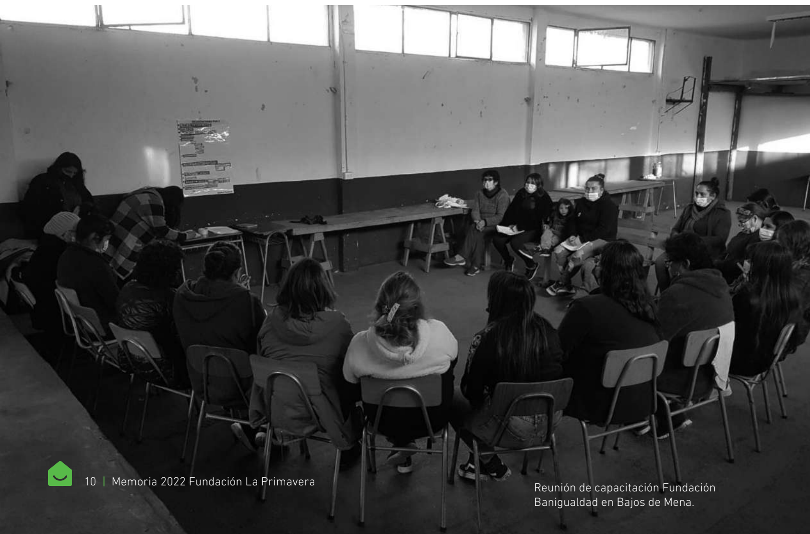
Reunión de capacitación Fundación Banigualdad en Bajos de Mena.

En todos los trabajos realizados, la buena relación con el Ministerio de la Vivienda y el Serviu Metropolitano fue fundamental para ejecutar trabajos que realmente fueran importantes para las distintas comunidades.