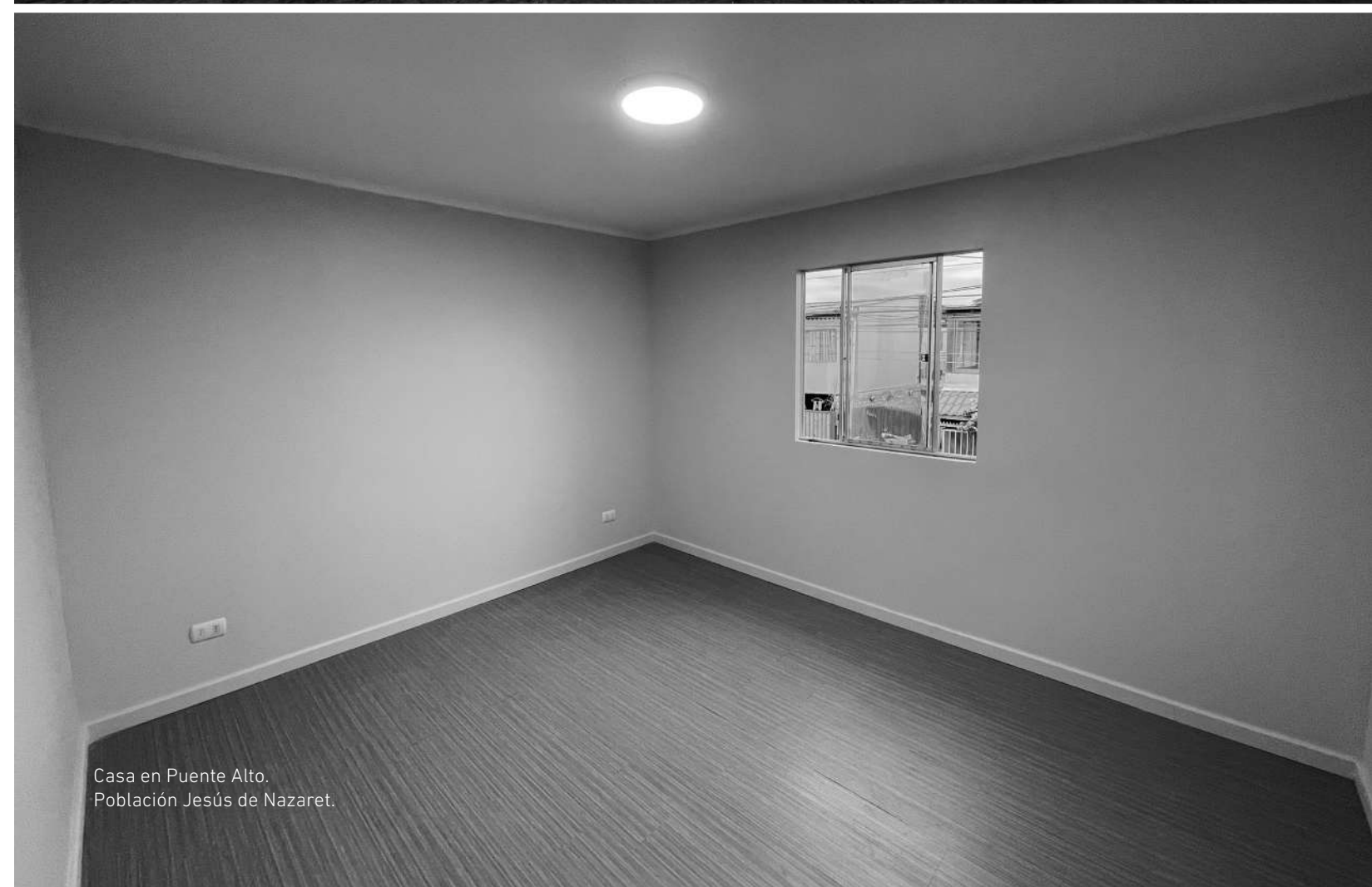
Casa en Puente Alto. Población Jesús de Nazaret.