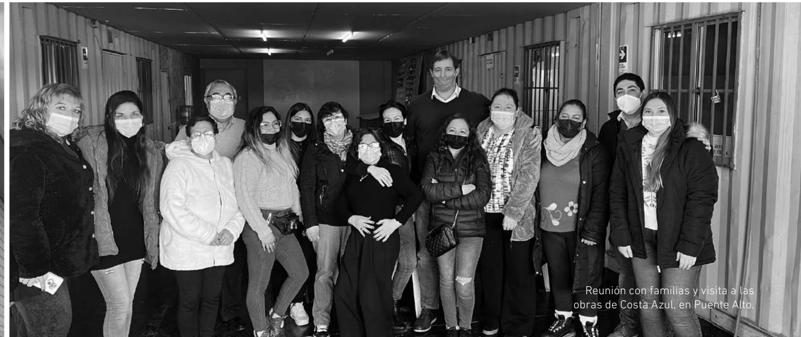
Reunión con familias y visita a las obras de Costa Azul, en Puente Alto.