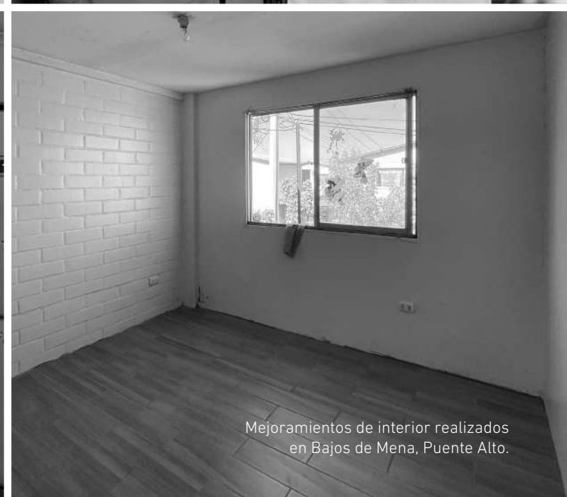
Mejoramientos de interior realizados en Bajos de Mena, Puente Alto.