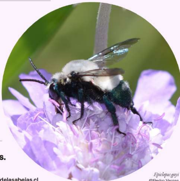
Epiclopus gayi @Pedro Vargas

@mabfundación fundacionmuseodelasabejas.cl