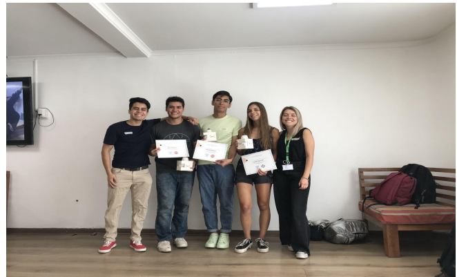
Encuentro de cierre