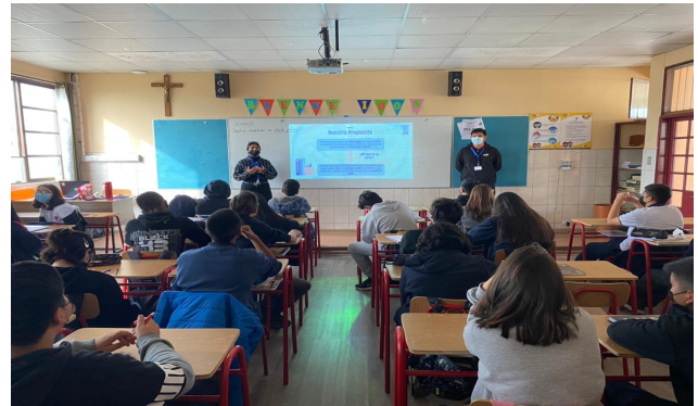
Programa 1º Medios