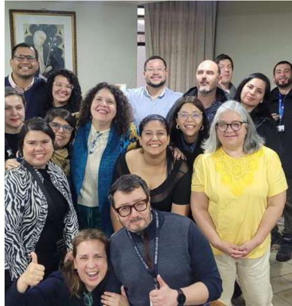
Vinculación | Organizaciones Sociales