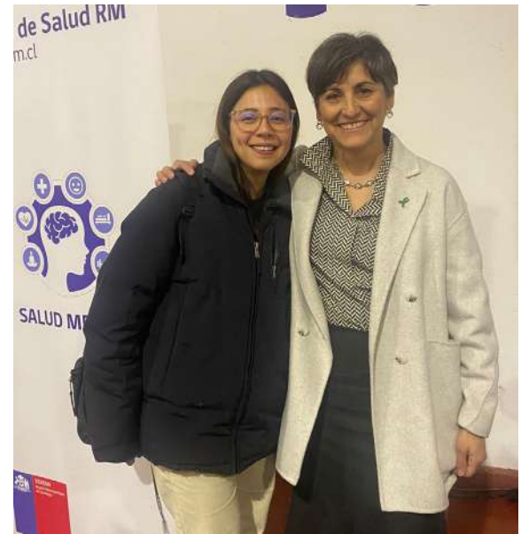
Vinculación | Seremi de Salud