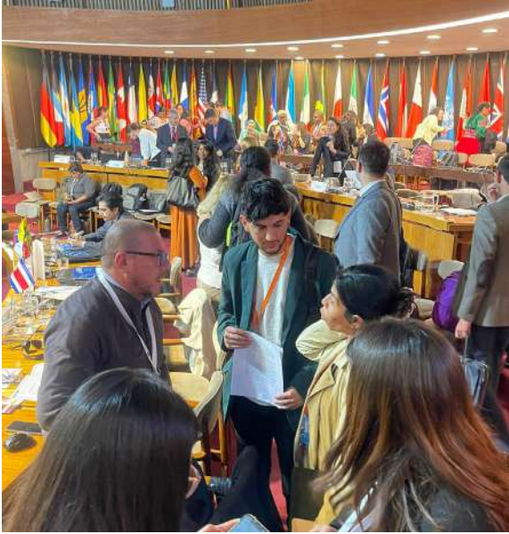
Vinculación | COSOC INJUV