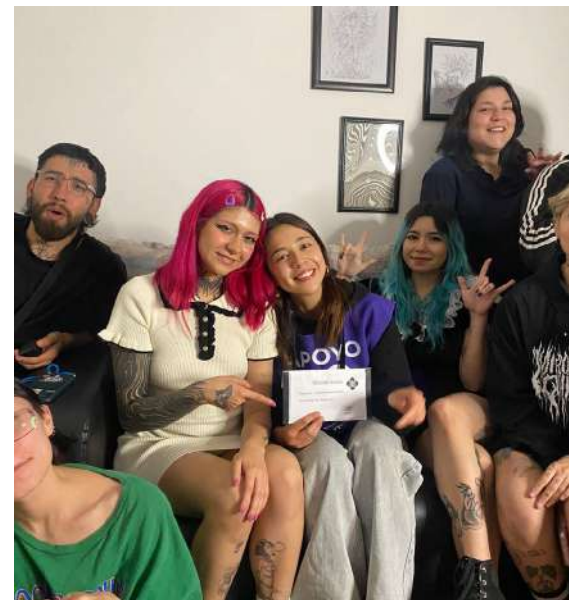
Vinculación | Campaña Navidad

Además, la vinculación con el entorno proporciona una comprensión más profunda de los desafíos y oportunidades locales, permitiendo el diseño de intervenciones más contextualizadas y relevantes. Asimismo, fortalece la colaboración y el intercambio de recursos, promoviendo un enfoque integral y sostenible para mejorar la calidad de vida de los niños y fomentar su desarrollo integral.