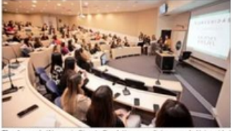
El estreno de Women in Dispute Resolution se realizó ayer en la Universidad Adolfo Ibáñez.