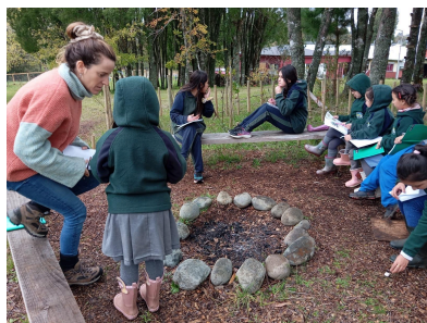
2024 Escuela Coligual, Llanquihue

Nuestra misión en el programa es fortalecer las habilidades para la vida por medio del trabajo en el jardín de la escuela, haciendo uso del Jardín Nativo como un aula al aire libre, siempre teniendo como objetivo central, conectar a los estudiantes con la naturaleza y promover la educación ambiental y el bienestar emocional.