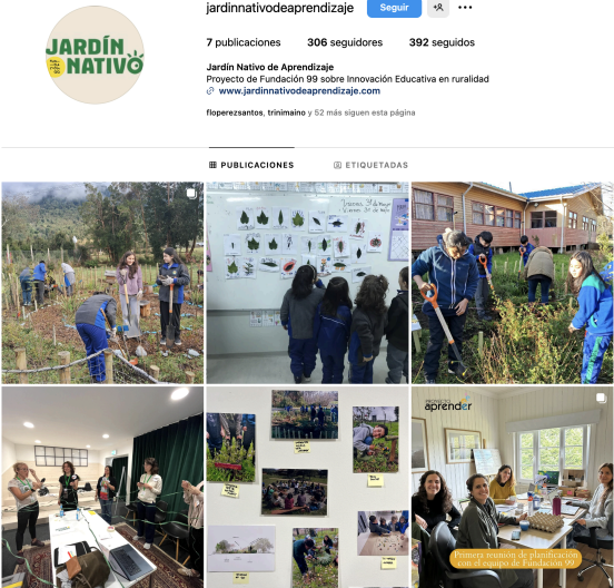
Publicaciones del Programa