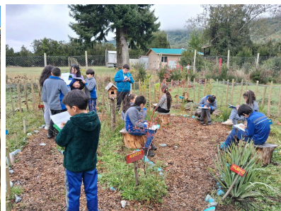
2024 Escuela Cristo Rey, Ralún, PV

El programa sigue siendo gratuito para las comunidades escolares rurales por las antes mencionadas adjudicaciones de fondos de filantropía en educación y desarrollo integral (Fundación Mustakis y Fundación Colunga 2022-2024). Y estamos en el desarrollo y prototipado de nuevas líneas de negocios para continuar nuestra misión e impactar en comunidades de contextos sociales vulnerables.