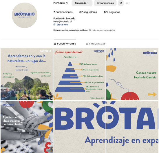
Publicaciones de la Fundación

Asimismo, Jardín Nativo de Aprendizaje fue uno de los 34 programas seleccionados que promueven el bienestar en las escuelas en el mundo por la agencia de innovación educativa finlandesa Hundred. Acá la publicación del programa y link de la publicación en su sitio web.