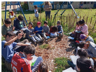
2024 Escuela Los Bajos, Frutillar