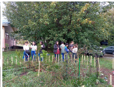
2024 Escuela Loncotoro, Llanquihue

Nuestro equipo visita las 10 escuelas del programa cada semana, implementando junto a los y las docentes actividades que promueven el cambiar de aula, salir afuera, observar, detenerse y preguntarse asuntos relacionados a las dinámicas de la naturaleza y colaborar para encontrar respuestas.