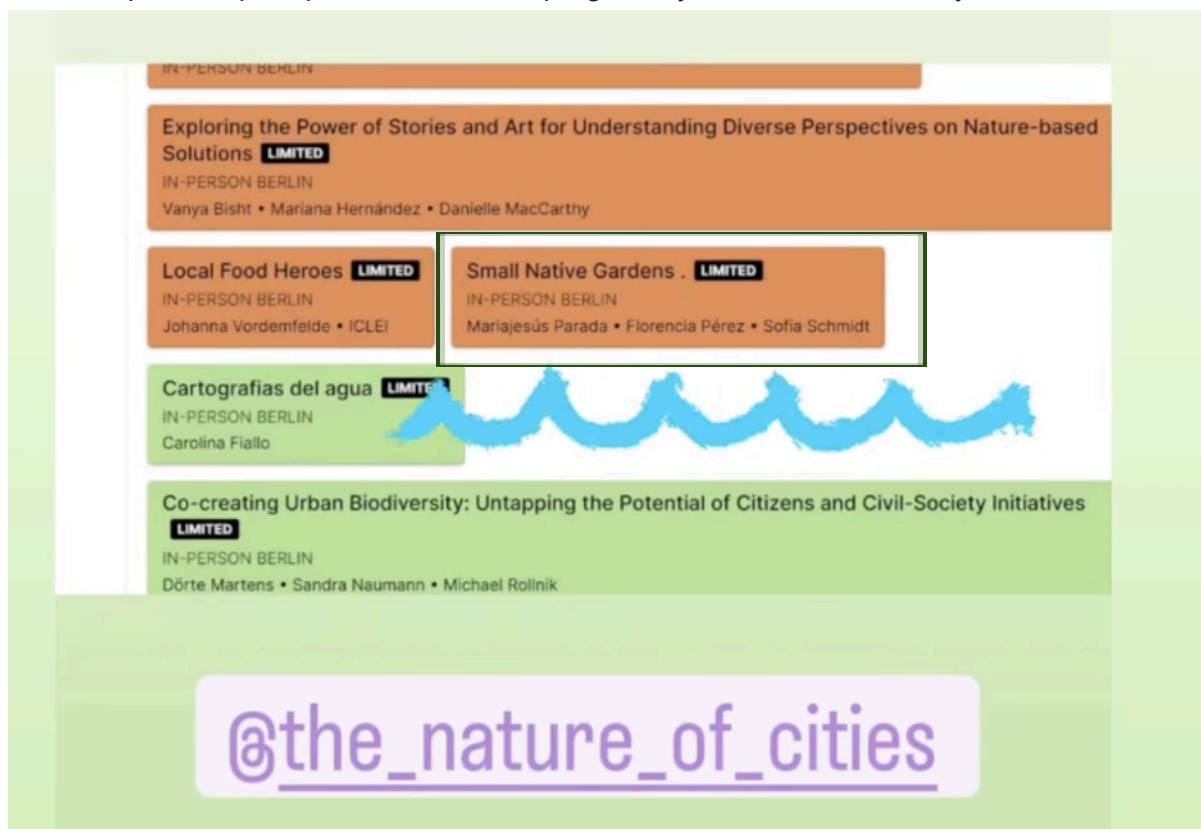
Publicación del instagram de The Nature of Cities.

En junio del 2024 participamos del The Nature of Cities Festival en Berlín, haciendo una actividad práctica para presentar nuestro programa y hablar de los niños y la naturaleza.