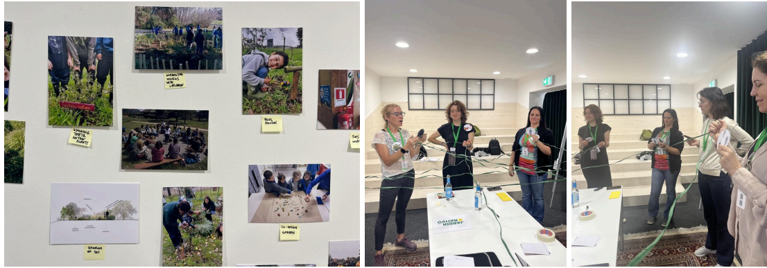
Fotos de nuestra actividad práctica “Small Native Gardens” realizada en TNOC, Berlin.

Contamos con un sitio web donde podrán encontrar la estructura del programa, videos y fotos. www.jardinnativodeaprendizaje.com .