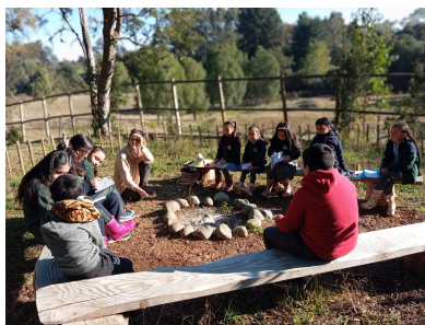
2024 Escuela Coligual, Llanquihue