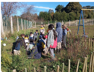
2024 Escuela Los Bajos, Llanquihue