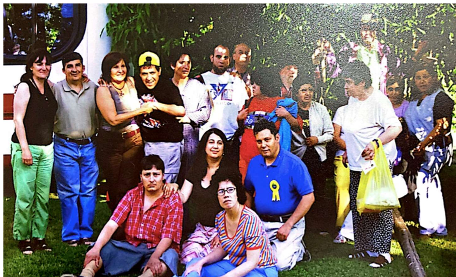
Paseo por celebración de cumpleaños de alumno, año 2011.

Tal como mostramos en estas fotos en que se ven actividades que realizamos hace ya más de 10 años.