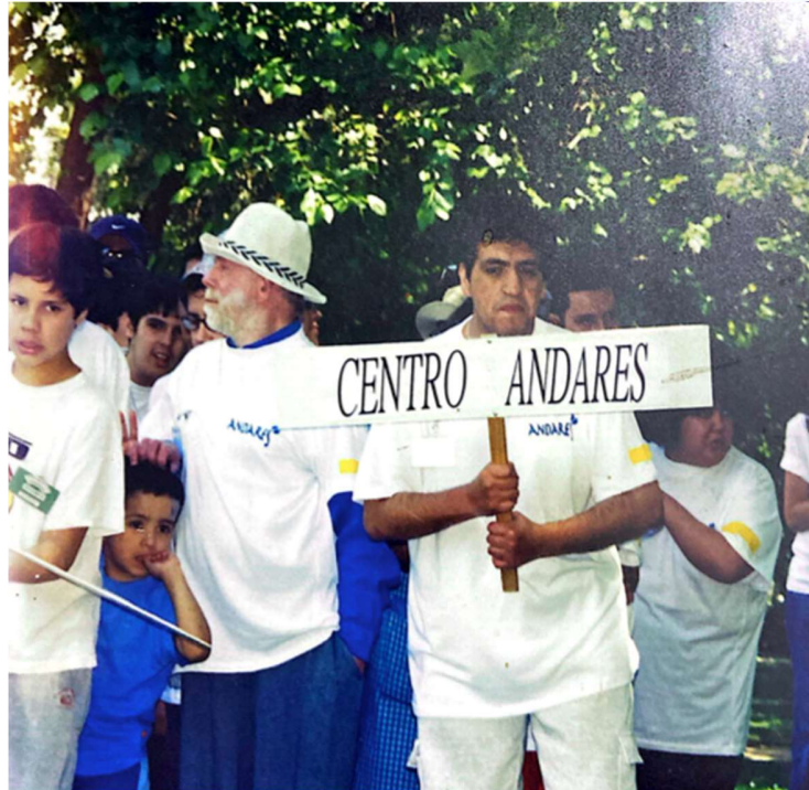
Presentación Centro Andares en actividad de la Municipalidad de Providencia.

Así, en el 2022, decidimos constituir la Fundación Andres con el fin de asegurar nuestra continuidad a largo plazo y proyectarnos en alcanzar un mayor impacto social.