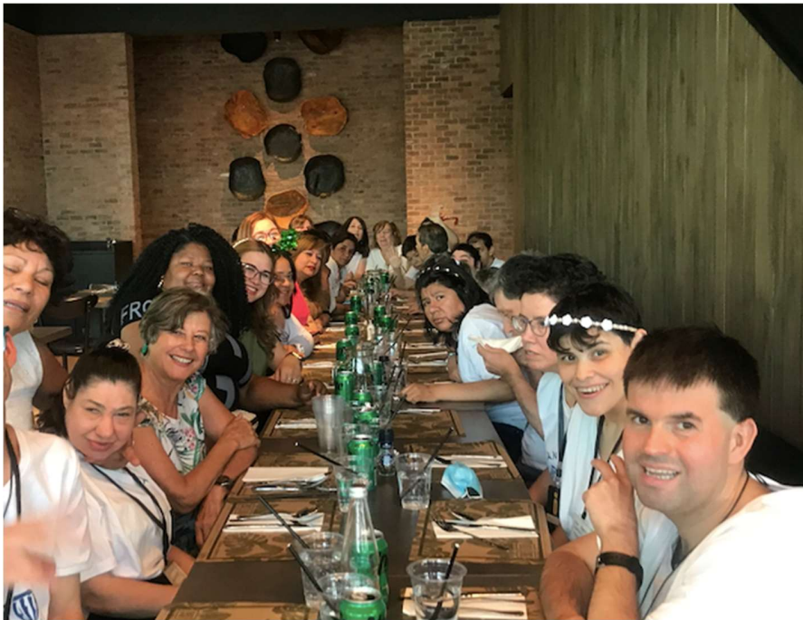
Almuerzo Celebración de la Navidad, año 2023.

Dentro de las actividades recreativas efectuadas en el año 2023, está el almuerzo de navidad con todos los alumnos y el personal y fiesta por año nuevo.