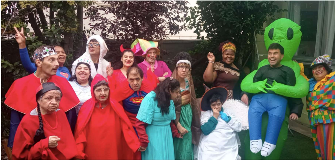
Celebración Año nuevo, año 2023.

Todo este funcionamiento, fue diseñado para cumplir de la mejor manera nuestros objetivos como centro y fundación para personas con discapacidad intelectual.