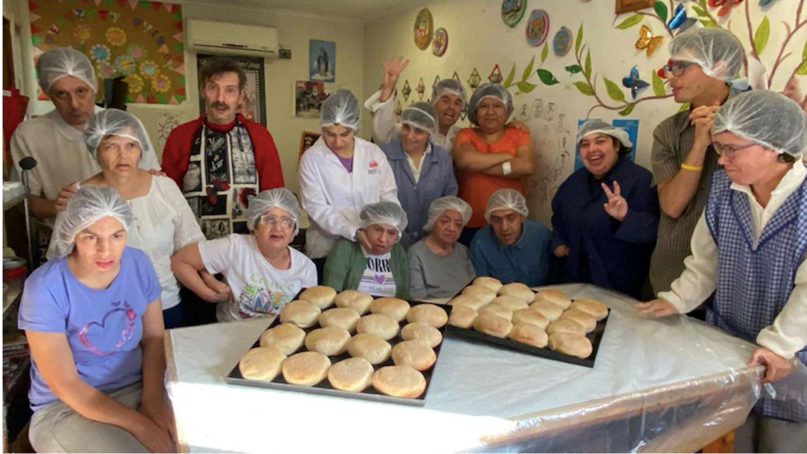
Taller amasandería, año 2024.