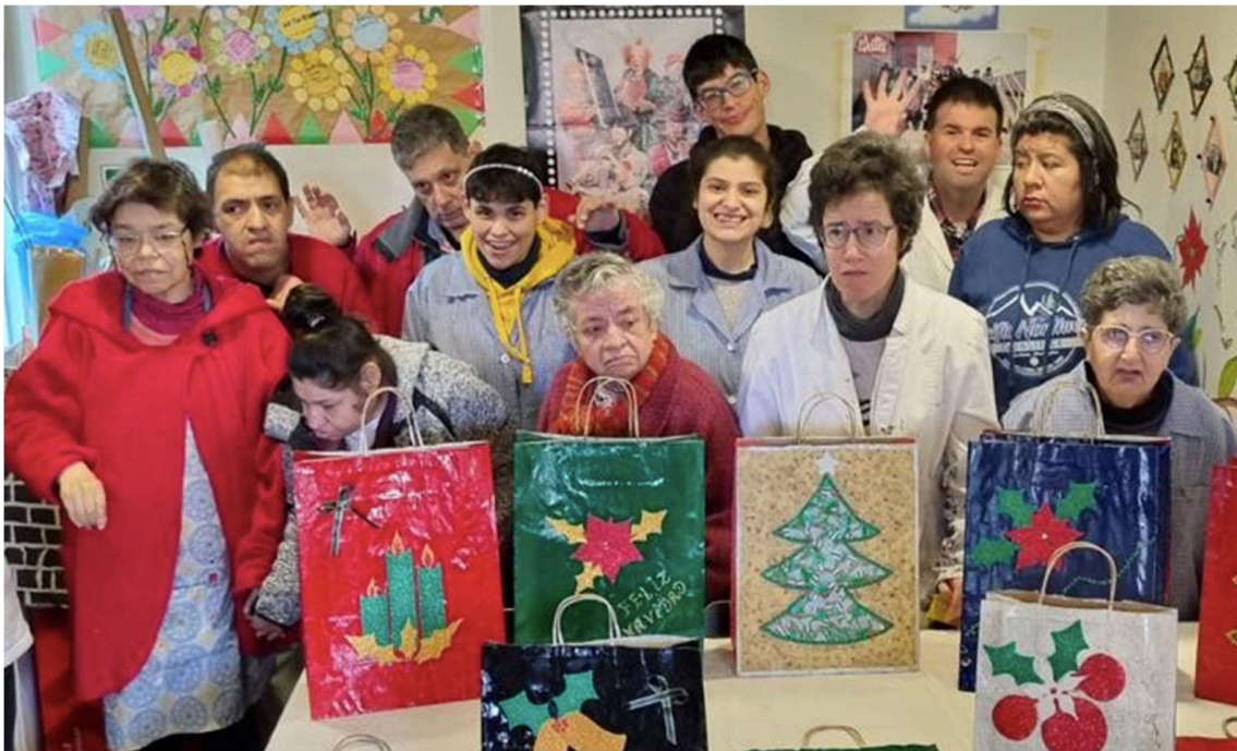
Taller manualidades, año 2023.