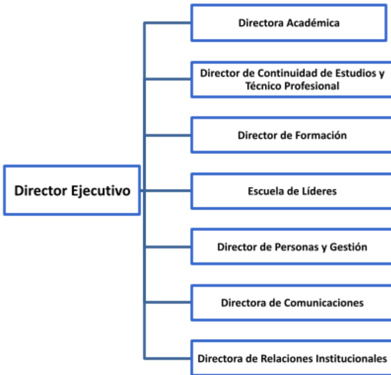
Ilustración 1: Organigrama Casa Central