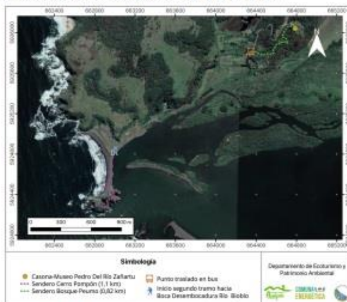
Figura 1. Propuesta de recorrido con delegación Escuela Quillaleo.

A continuación, se muestra a través el recorrido propuesto con las caminatas establecidas y el punto de traslado en bus: