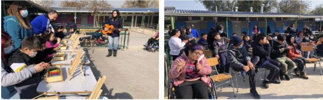
Actividad Musical Con Estudiantes 19 de Junio 2023

19 de junio: “Actividad Musical con estudiantes de la Escuela Diferencial Humberto Aranda, se realiza en el establecimiento.