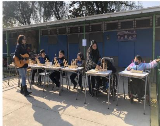
Actividad Musical Con Estudiantes 19 de Junio 2023