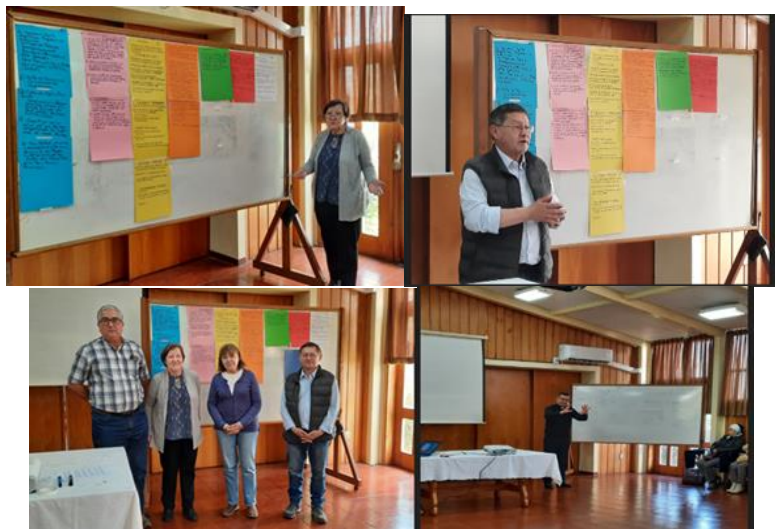
Algunas fotos muestran el desarrollo de la actividad