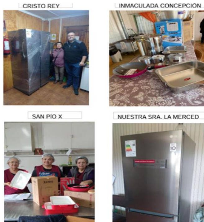
Algunas fotos muestran el resultado de los fondos aprobados por Fundación Emmanuel para equipar comedores..

Se postularon en total 9 proyectos por $12.029.893.- 7 de los cuales fueron aprobados por un total de $4.229.893.- Los últimos tres proyectos postulados se encuentran en etapa de revisión por el Fondo.