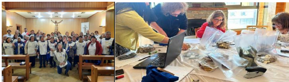
Parte del equipo de terreno en el envío y, arqueo.