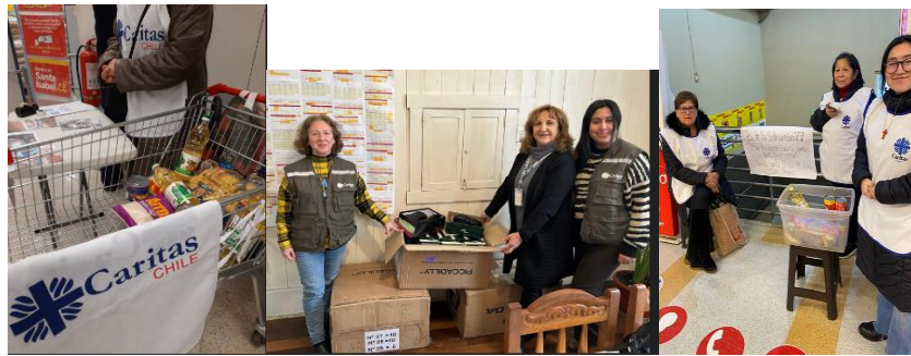
Entrega zapatos en Colegio María Deogracia

Este año 2024 se realizó en el contexto mes de la solidaridad una recolección de alimentos en supermercado y casas y se recibió un aporte de 60 pares de zapatos llevados a la escuela María Deogracia de Futrono para beneficiar a niños provenientes del sector rural. Esto suma al esfuerzo realizado en esta misma línea por las pastorales parroquiales que en forma permanente recaudan alimentos en las parroquias para la entrega de cajas de alimentos a personas vulnerables y también desarrollan actividades de este tipo en hitos especiales de iglesia.