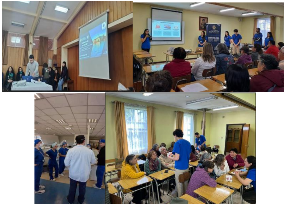
Graficas que muestran parte del desarrollo del proyecto

En este proyecto se invirtieron por parte de Caritas cerca de $300.000 y por parte de la USS una cantidad superior. Para las personas beneficiadas fue gratuito.