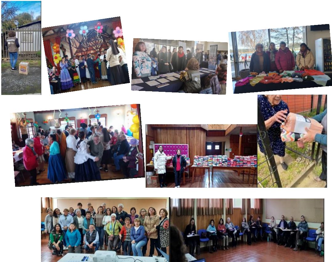
Se muestran algunas graficas de las actividades realizadas.

Finalmente mencionar que dentro de este contexto igualmente por contingencia social, se realizó una donación de pañales a la fundación Las Rosas, fueron 24 paquetes de 20 pañales cada/uno (total 480 pañales), por un monto total $210.960.- Esto independiente una entrega de 88 pañales (4 Pqtes. de 22 pañales cada uno), en contexto de donación y que si se valoriza alcanzaría la suma $35.000.-. Adicionalmente durante el mes de la solidaridad se realizan campañas de alimentos y otras por las respectivas parroquias.