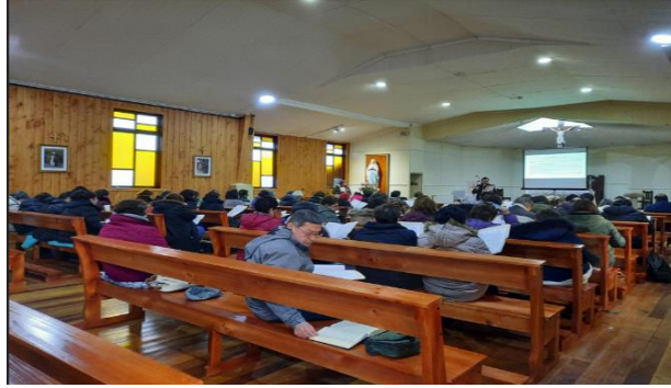
Gráficas muestran diversas actividades realizadas en complementación a otros proyectos.

Con estos recursos se puede apoyar las actividades de las pastorales parroquiales y específicas.