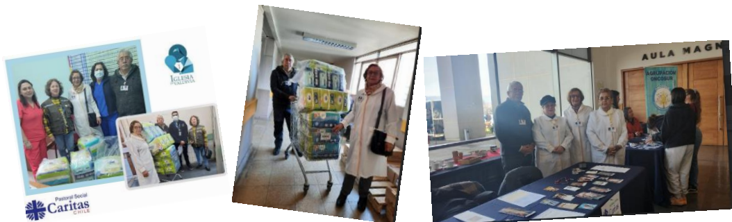
Se muestran algunas graficas de las obras realizadas.

Finalmente, viendo el estado en que se encuentra la Capilla, Caritas postuló un proyecto al fondo "Chile Pinta", lamentablemente este proyecto fue rechazado pues la Capilla tiene daño mayor lo que no se resolvía con este el proyecto.