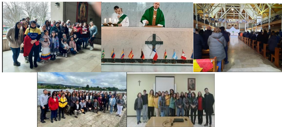
Algunas graficas de actividades para y con migrantes (misa, mesa regional SERMIG, capacitación)

Finalmente y como es tradicional, en septiembre 2024, se celebró la misa del migrante y refugiado y la colecta Nacional de Incami con una recaudación igual a $974.410.-, depositado directamente a la cuenta Incami, cifra que es menor a la del año 2023 ($1.164.610).- La misa fue oficiada en la Catedral, por el P. Santiago Silva Retamales, Obispo de Valdivia, en la presencia de más de 100 asistentes, entre chilenos y extranjeros provenientes de distintos países. Varias organizaciones de migrantes y el servicio Nacional de Migraciones de Los Ríos nos acompañaron.