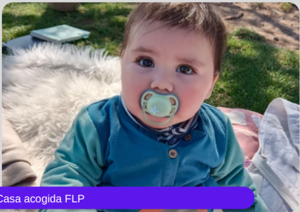
Casa acogida FLP