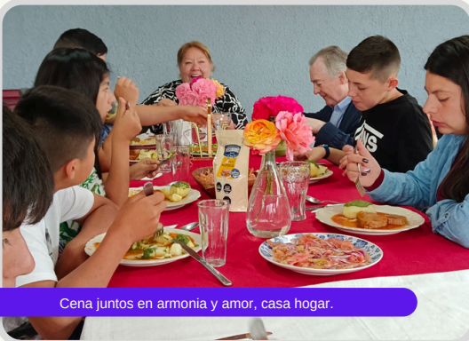
Cena juntos en armonía y amor, casa hogar.

~ Ponemos nuestras capacidades al servicio de los demás en forma colaborativa, en beneficio de nuestra institución, nuestros usuarios y sus familias.