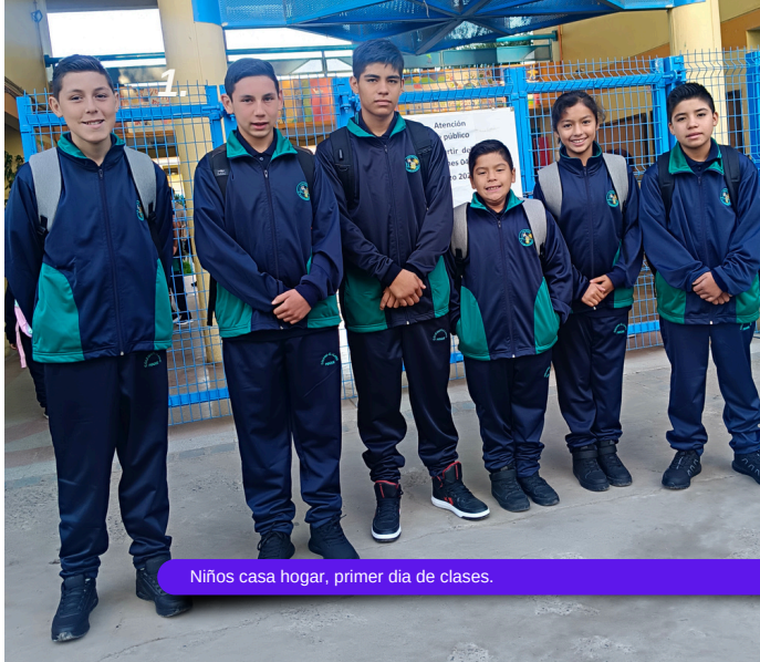
Niños casa hogar, primer día de clases.

“Ser una alternativa al cuidado de niños en situación de riesgo psicosocial, que incorpora los valores del respeto, amor, cuidado y espiritualidad como ejes centrales de trabajo”.