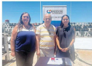
FIRMARON CONVENIO CON MUNICIPIO ARGENTINO SANTA ELENA.

"Nosotros venimos llegando de Argentina con el equipo Pelumo de Villa Alemana. La idea es dignificar a estos deportistas senior con espacios donde se pueda promover su salud física y mental, y así mantener a estas personas activas. Estas actividades se enmarcan en el programa 'Renovando cuerpos y re-