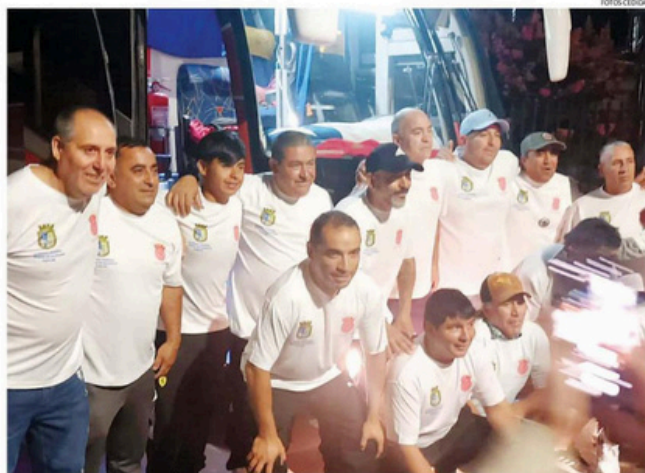
UNA DE LAS DELEGACIONES DE DEPORTISTAS SENIOR, DEL CLUB EL PELUMO DE VILLA ALEMANA, QUE FUE A ARGENTINA.

comunas son las que abarca dentro de la región la Fundación Pasión Sin Fronteras con su trabajo social.