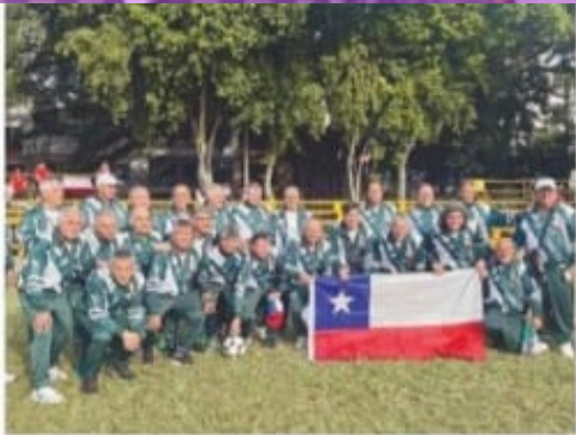
EL EQUIPO REFUGIO DE CRISTO DE VALPARAÍSO ESTARÁ PRESENTE.