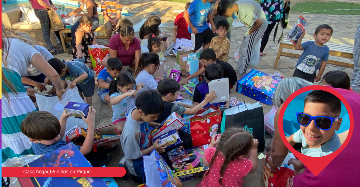
Casa hogar, 65 niños en Pirque