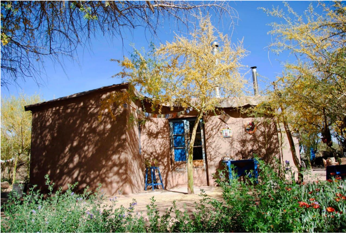
Casona Fundación La Tintorera, San Pedro de Atacama.