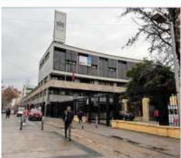
El acto de conmemoración se inició con una modernización busca mejorar el compromiso por espacios más dignos y seguros para la educación.

Apoderados señalan que el proceso de remodelización se extendió más de lo prometido dificultando la normalidad y generando clases híbridas gran parte de este año.