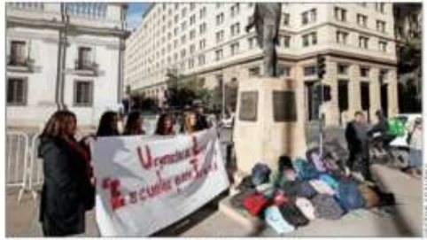
Una delegación de padres asistió a entregar la carta.