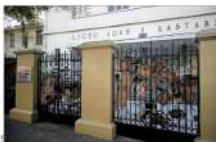
El Liceo José A. Lastarria, en Santiago, es uno de los liceos emblemáticos que forman parte del protocolo de acuerdo suscrito el año pasado para destrabar el presupuesto de Educación.

El acuerdo se suscribió entre el Mineduc y la AFE, pero no se han visto avances en la recuperación de los liceos emblemáticos.