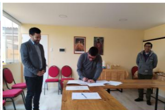
19.06.2024 Firma de Convenio Corporación San Marcos y Fundación Altiplano