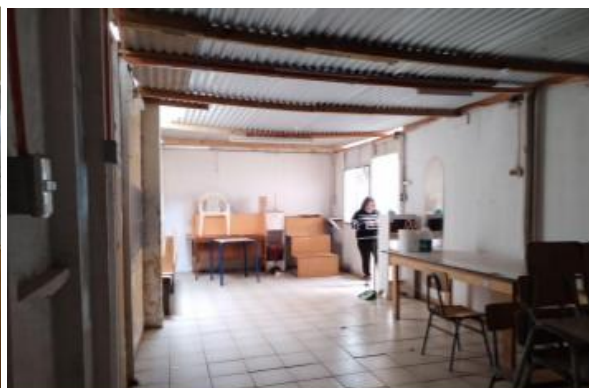
10.06.2024. Levantamiento de construcción existente y análisis de prevención de riesgos.