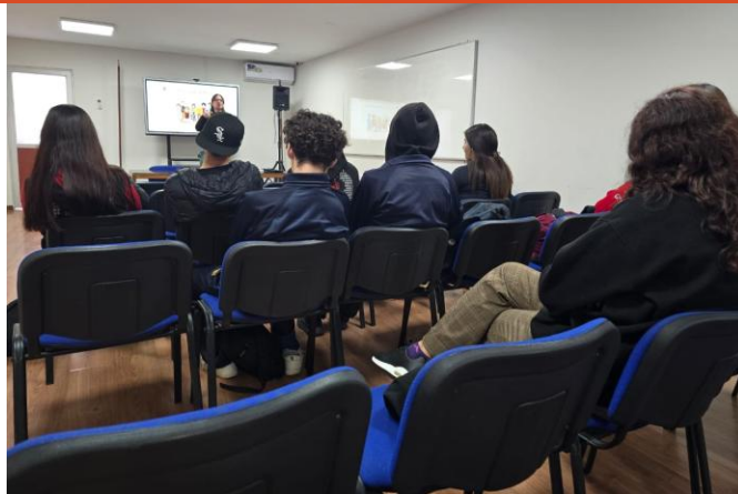
Agosto 2025. Estudiantes en Talleres Psicológicos