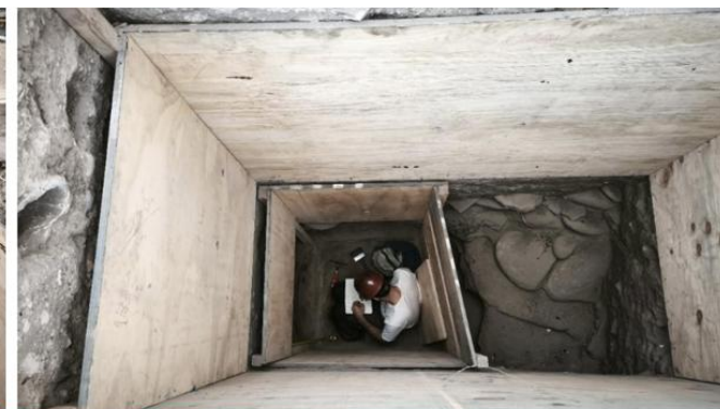
Fotografías de trabajos realizados en el mes de marzo en terreno de Catedral.