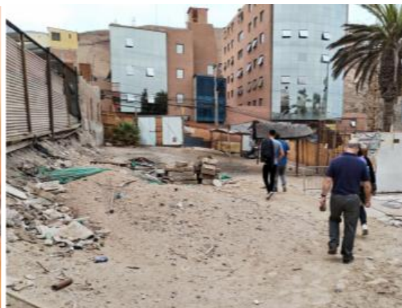
26.04.2024. Revisión de estado actual del terreno.