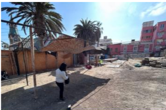
12.06.2024. Levantamiento para planificación de cierre perimetral.