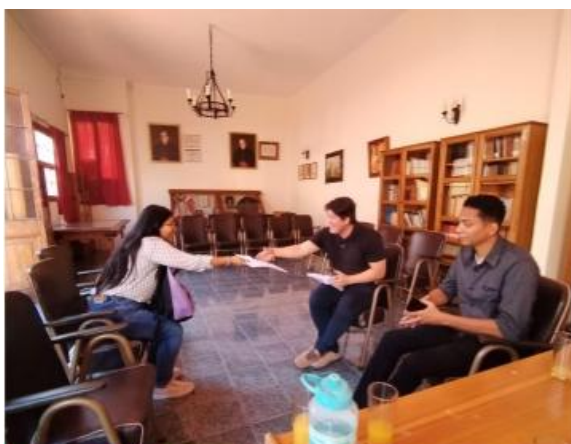
17.04.2024.Reunión de coordinación inicial.

A continuación, se presentan extractos fotográficos: