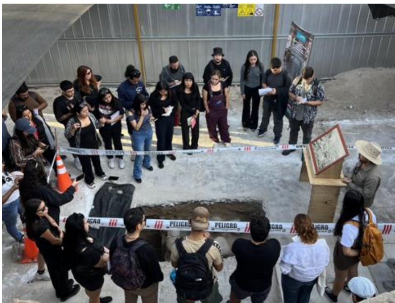
Estudiantes de la UTA realizando visita/taller al terreno.