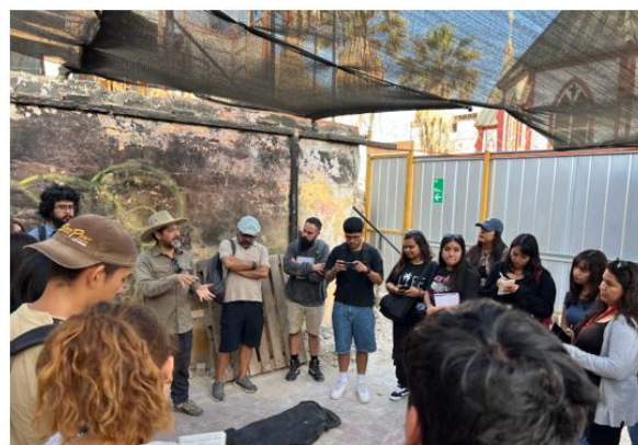
Fotografías de visitas realizadas en el mes de marzo en terreno de Catedral.