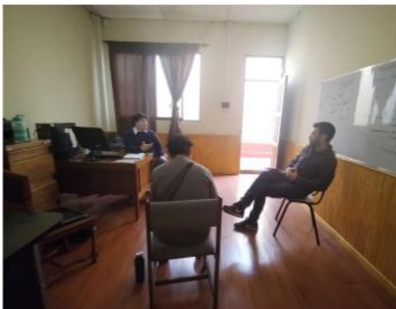
20.05.2024 . Equipo de arqueología y estimaciones de fechas.