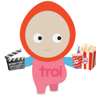
Experiencias para sonreír