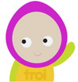
Apoyo social a familias