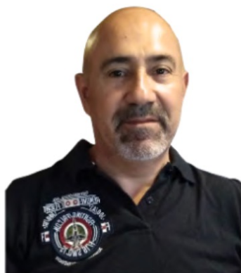
JUAN NAVARRO CASTILLO producción y archivo musical