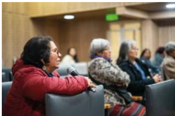
dirigiendo el conversatorio