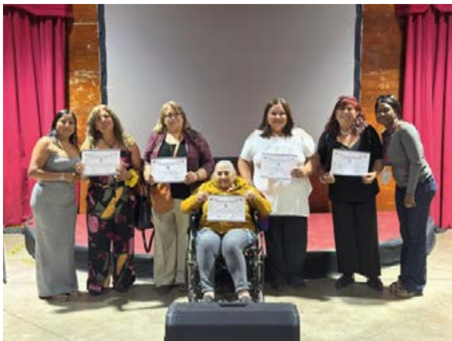
Certificación mujeres migrantes y no migrantes Pudahuel Rural