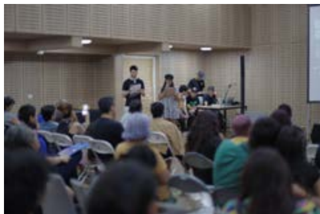
Centro Cultural Anita González, Pudahuel