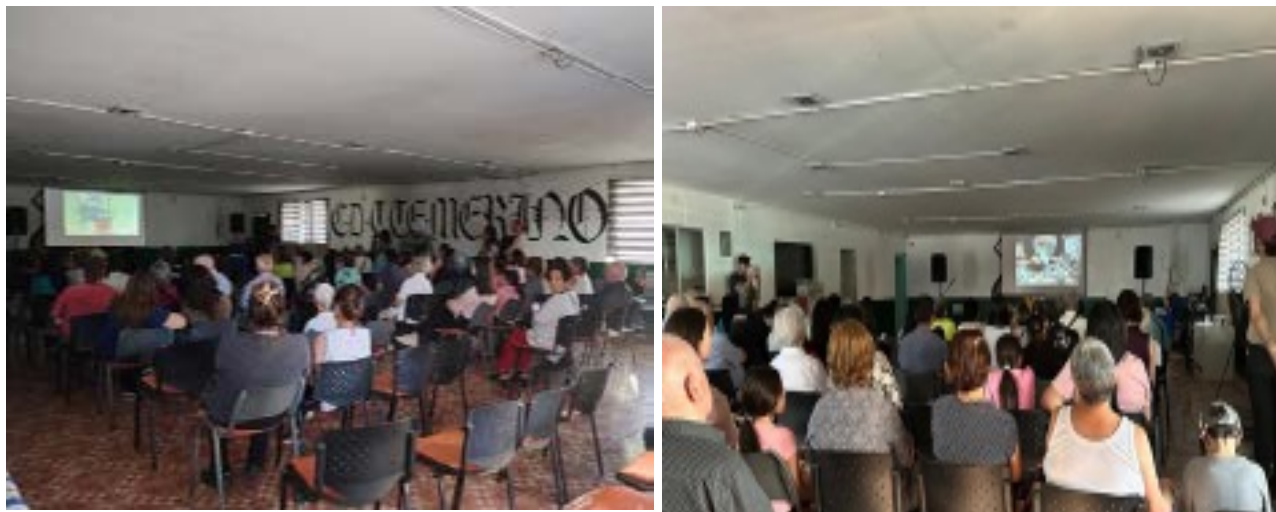
Club Deportivo Tte. Merino Las Tranqueras #1290, Pudahuel

Durante el mes de enero del año 2025 se realizó la primera Muestra de Cine Comunitario del grupo “CESFAM Cardenal”, agrupación formada durante los talleres de Cine Comunitario en la sede del Club Deportivo Teniente Merino, en Pudahuel. La actividad reunió a vecinas, vecinos y participantes del taller, junto al CESFAM Cardenal Silva Henríquez y el Club de Personas Mayores El Almendral, quienes compartieron las producciones creadas durante 2024. La jornada destacó por su ambiente participativo y comunitario, fortaleciendo los lazos y el sentido de pertenencia en torno al cine y la cultura local.