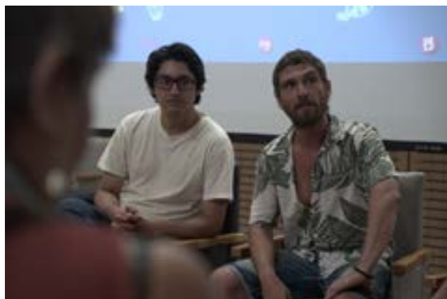
Centro Cultural Anita González, Pudahuel