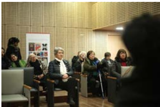
Centro Cultural Anita González, Pudahuel