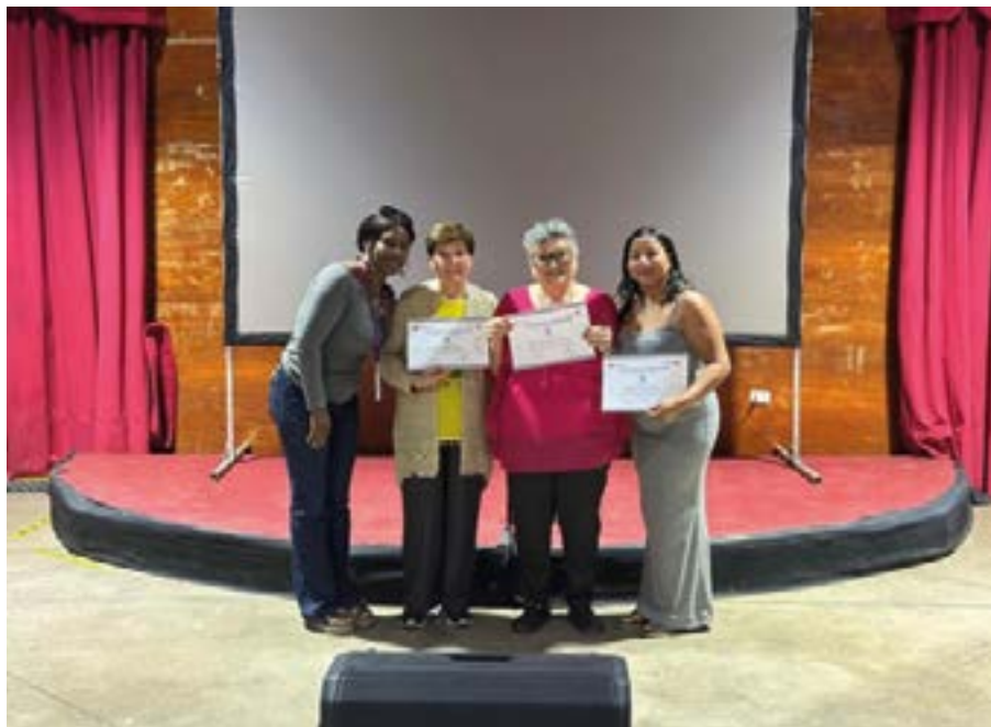
Certificación mujeres migrantes y no migrantes CESFAM Cardenal Silva, Pudahuel Norte