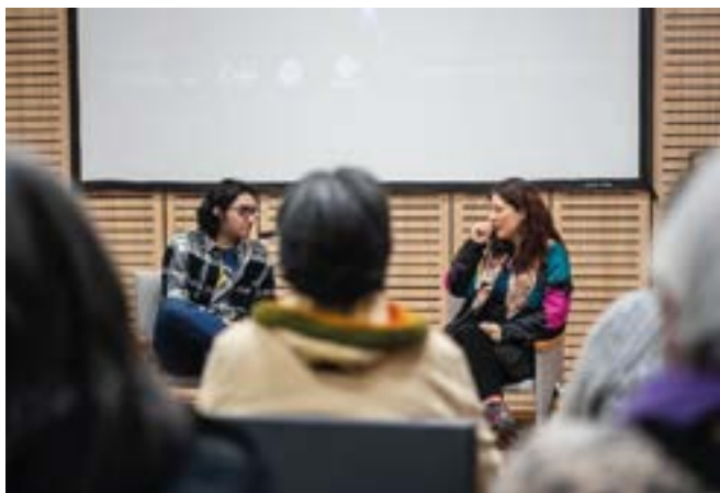
Invitados al Foro