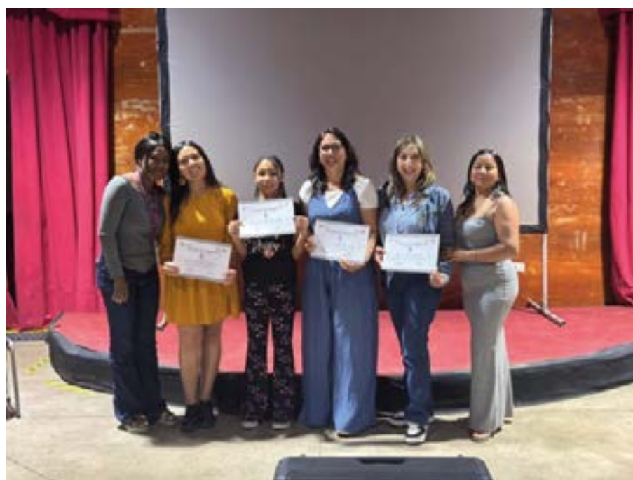
Certificación mujeres migrantes y no migrantes Pudahuel Norte