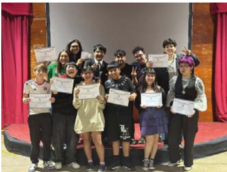
Taller jóvenes, Pudahuel Sur