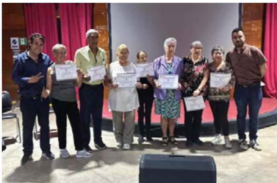
Taller Personas Mayores, La Vieja Escuela Pudahuel Norte ,