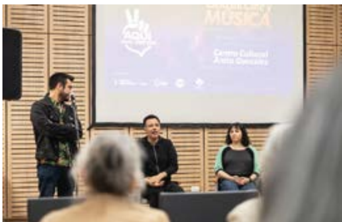
Director y Productora