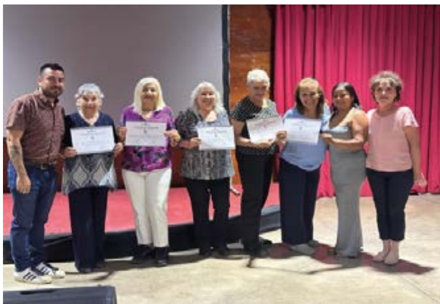
Taller Personas Mayores Comuna de Santiago