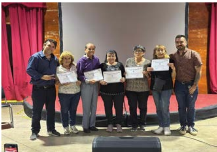
Taller Personas Mayores, Llitulun Ayekantun Pudahuel Norte,