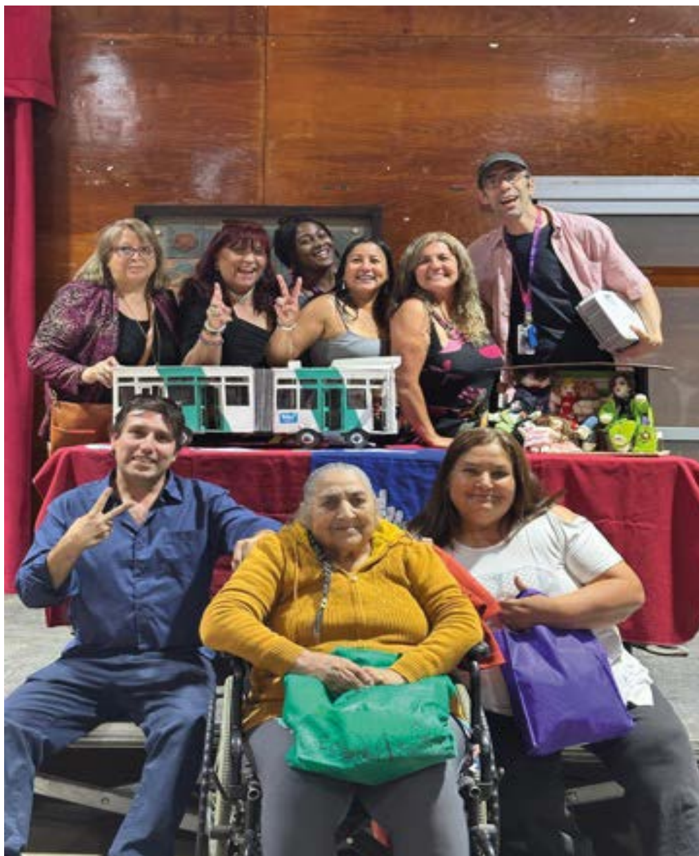
Equipo de Rural con sus creaciones para Stop Motion (animación)