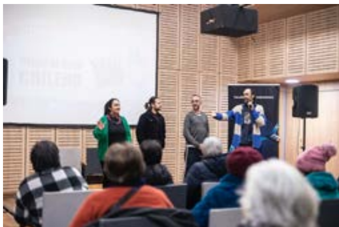
Sala en Centro Cultural conversatorio con Invitados, Pudahuel