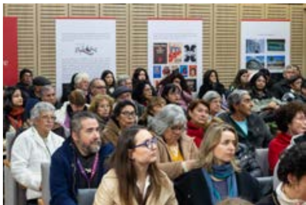
Público Ciclo Cine Ruso

https://www.instagram.com/p/C9Dy-jB0p2d/