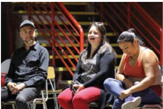
conversatorio sobre producción