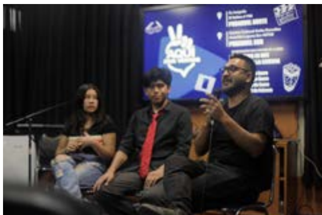
Sala en Centro Cultural, Ex Juzgado conversatorio, Pudahuel

https://www.instagram.com/reel/C2abkEFOCII/?igsh=MTNibmNybTJzbGllaQ==