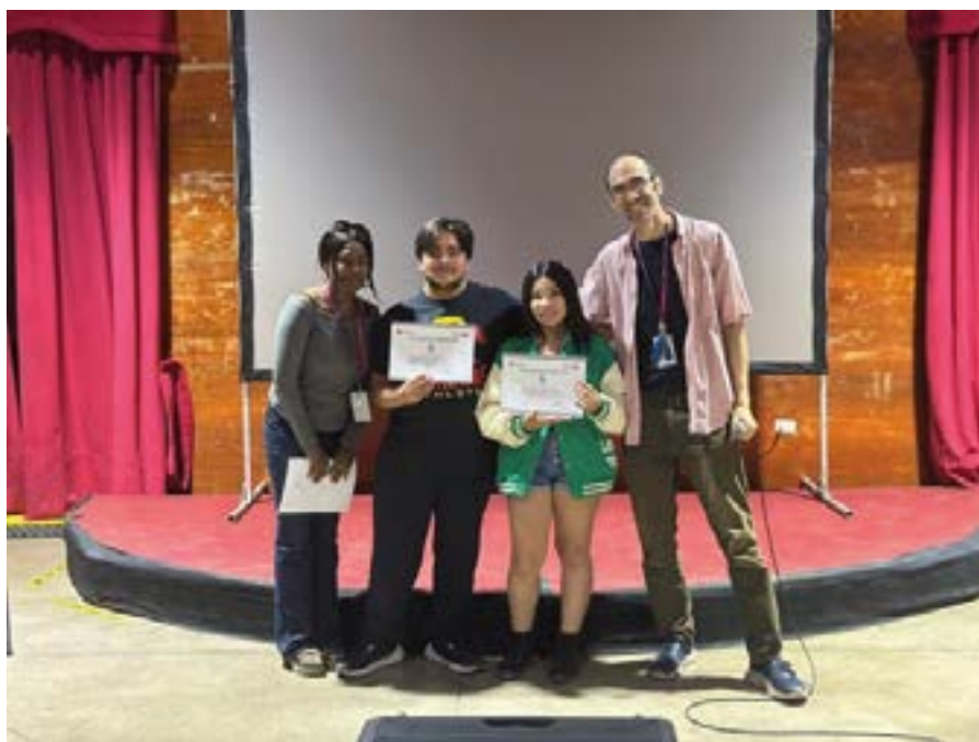
Taller jóvenes, Pudahuel Norte