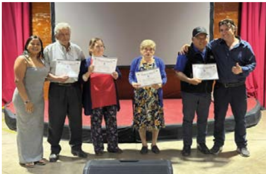
Taller Personas Mayores , El Almendral Pudahuel Norte