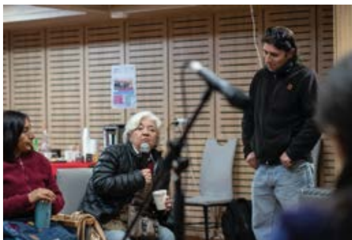
Centro Cultural Anita González, Pudahuel