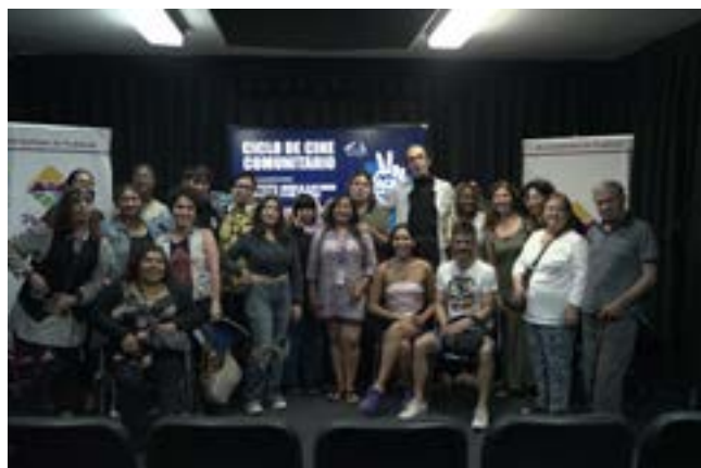
Sala en Centro Cultural el Salitre, Pudahuel

https://www.instagram.com/reel/C2abkEFOCII/?igsh=MTNibmNybTJzbGllaQ==