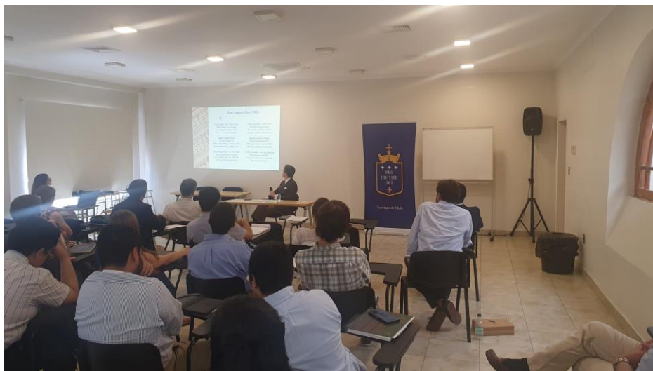
Ilustración 5: Profesor impartiendo una clase en la escuela de verano