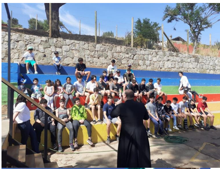
Ilustración 1: Una jornada de formación con adolescentes.

Escuela Luisa Nieto en Reñaca, Viña del Mar