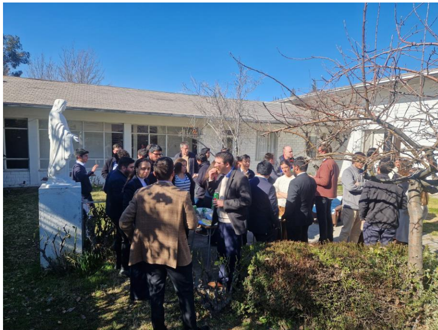
Ilustración 8: Recreo de asistentes a escuela de invierno.