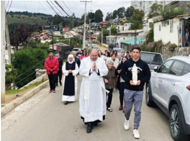
Ilustración 4: Procesión por las calles de la población Río Palena, en Viña del Mar.