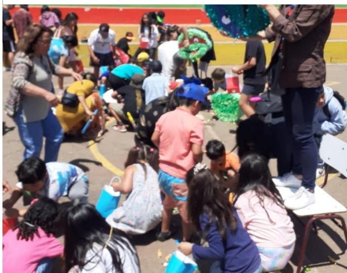
Ilustración 3: Voluntarios adultos desarrollando un taller de manualidades para los niños.