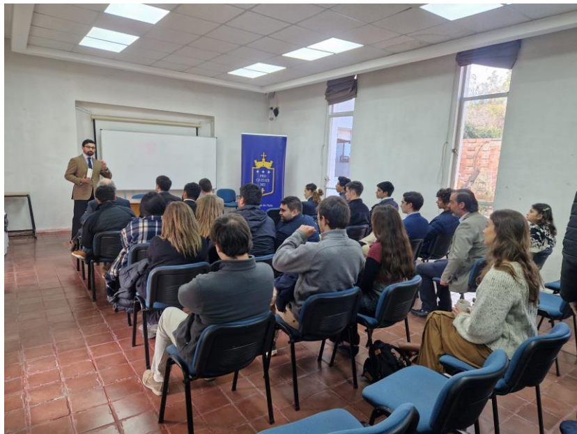
Ilustración 7: Profesor impartiendo una clase en la escuela de invierno