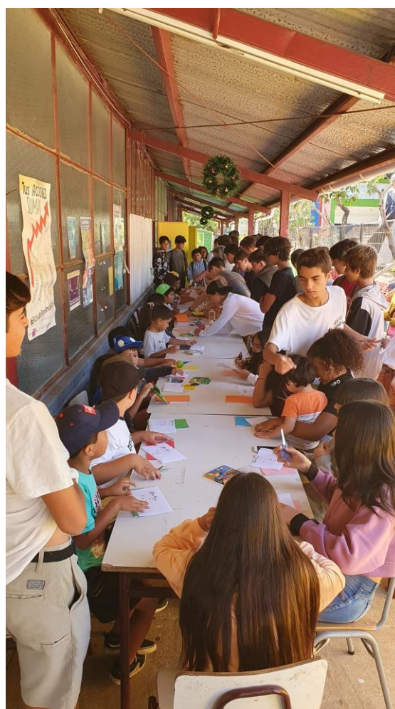
Ilustración 2: Jóvenes voluntarios ayudando en la jornada de manualidades de niños.