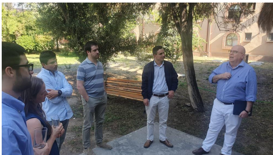
Ilustración 6: Profesor compartiendo con asistentes en escuela de verano.