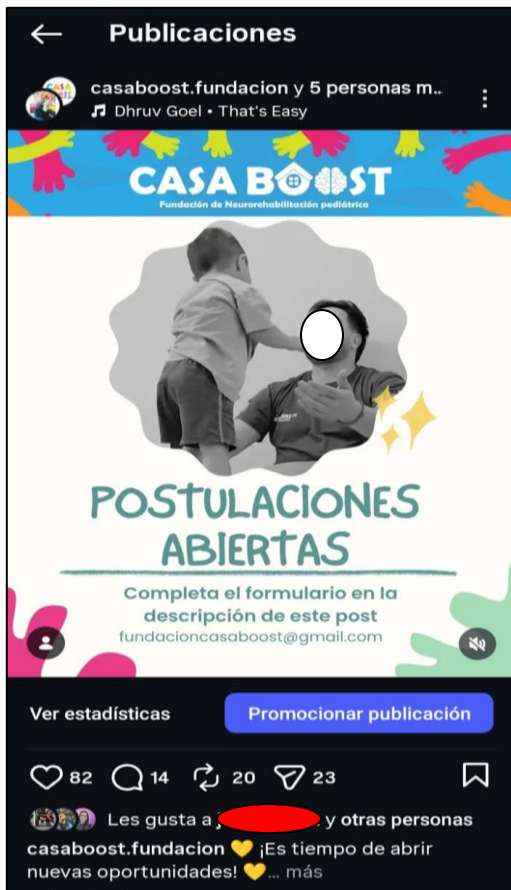
Anexo 1. Captura publicación Instagram Fundación