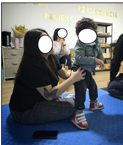
Anexo 3. Fotografías Institucionales