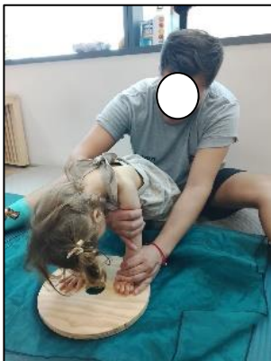
Anexo 6. Fotografías institucionales de sesiones