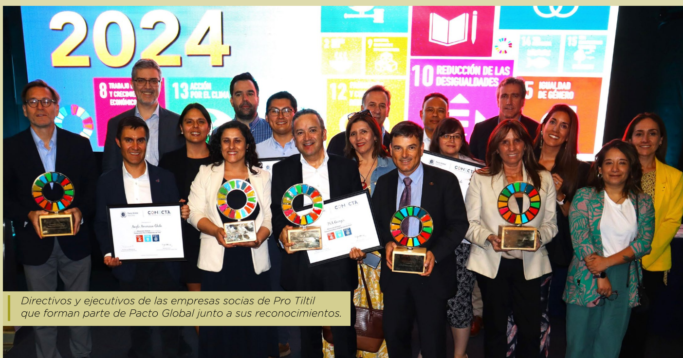
Directivos y ejecutivos de las empresas socias de Pro Tilttil que forman parte de Pacto Global junto a sus reconocimientos.

Todos los años, la red Pacto Global Chile lleva a cabo los Reconocimientos Conecta , donde destaca la contribución de sus compañías socias para el cumplimiento de los Objetivos de Desarrollo Sostenible 2030 (ODS). Forman parte de esta red de empresas las compañías ISA Energía, Anglo American, Westfalia Fruit Chile y EcoAZA, (a través de su matriz AZA).