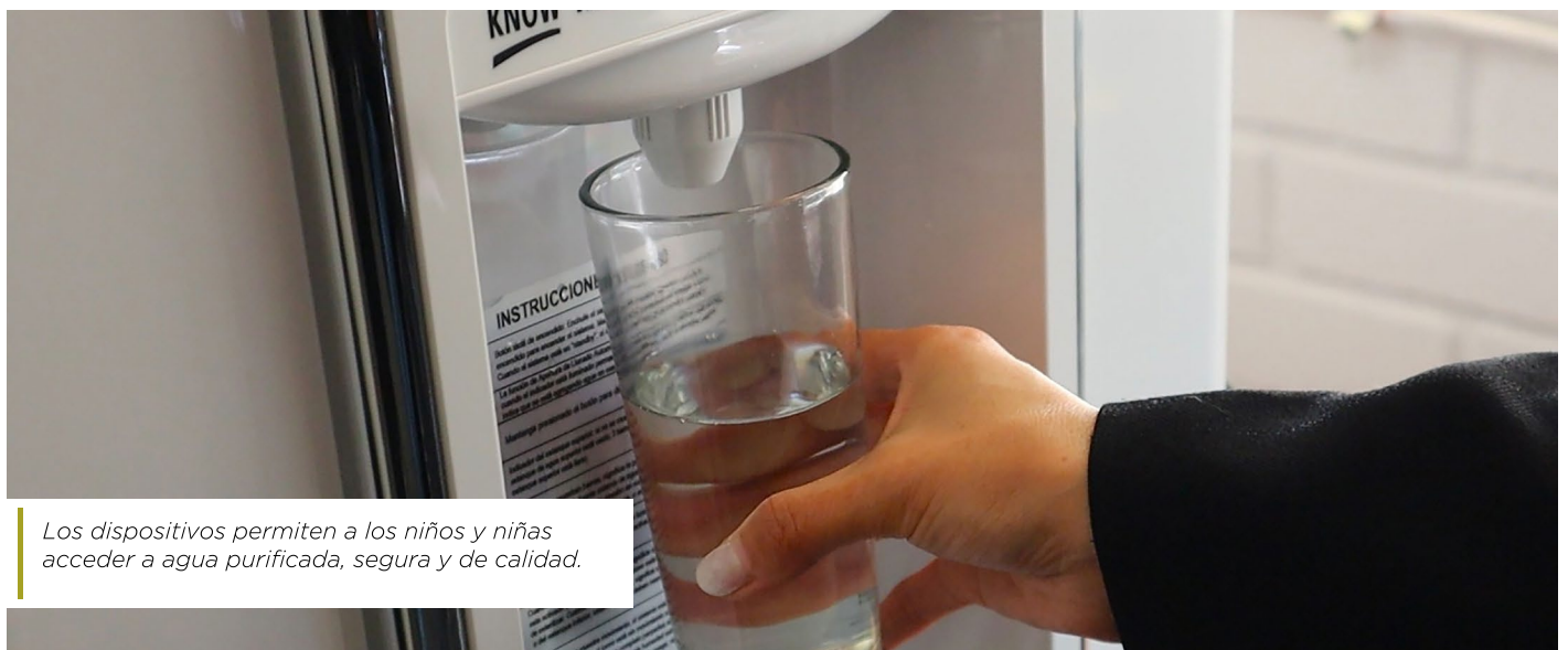
Los dispositivos permiten a los niños y niñas acceder a agua purificada, segura y de calidad.