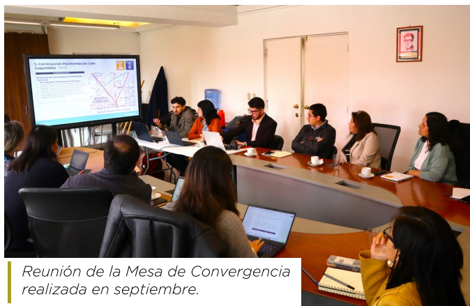
Reunión de la Mesa de Convergencia realizada en septiembre.

Durante 2024, con financiamiento de las empresas de Pro Tilttil, Isa Energía, Westfalia Fruit, KDM, Magotteaux Santiago Solar y EcoAZA, Fundación Huella Local ingresó en el municipio tres perfiles de proyectos, que a fines de diciembre se encontraban en etapa en proceso de formulación técnica para su financiamiento público: Pasarela Barros Arana, Centro Cívico de Huertos Familiares y Parque Nuevo Amanecer.