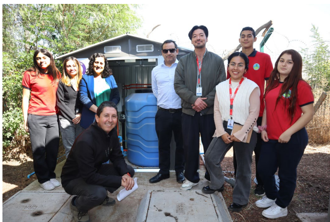
Inauguración del sistema de recuperación de aguas grises en Escuela Santa Matilde.