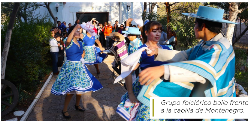
Grupo folclórico baila frente a la capilla de Montenegro.