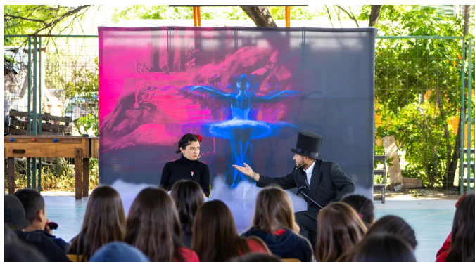
El objetivo de Teatro en las Escuelas fue promover la buena convivencia.