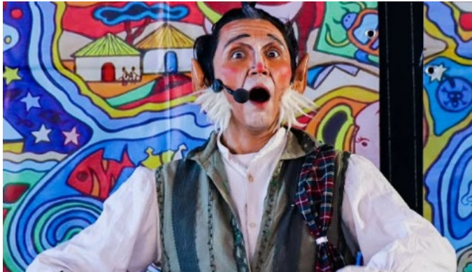
Función de Teatro Familiar en Localidades.