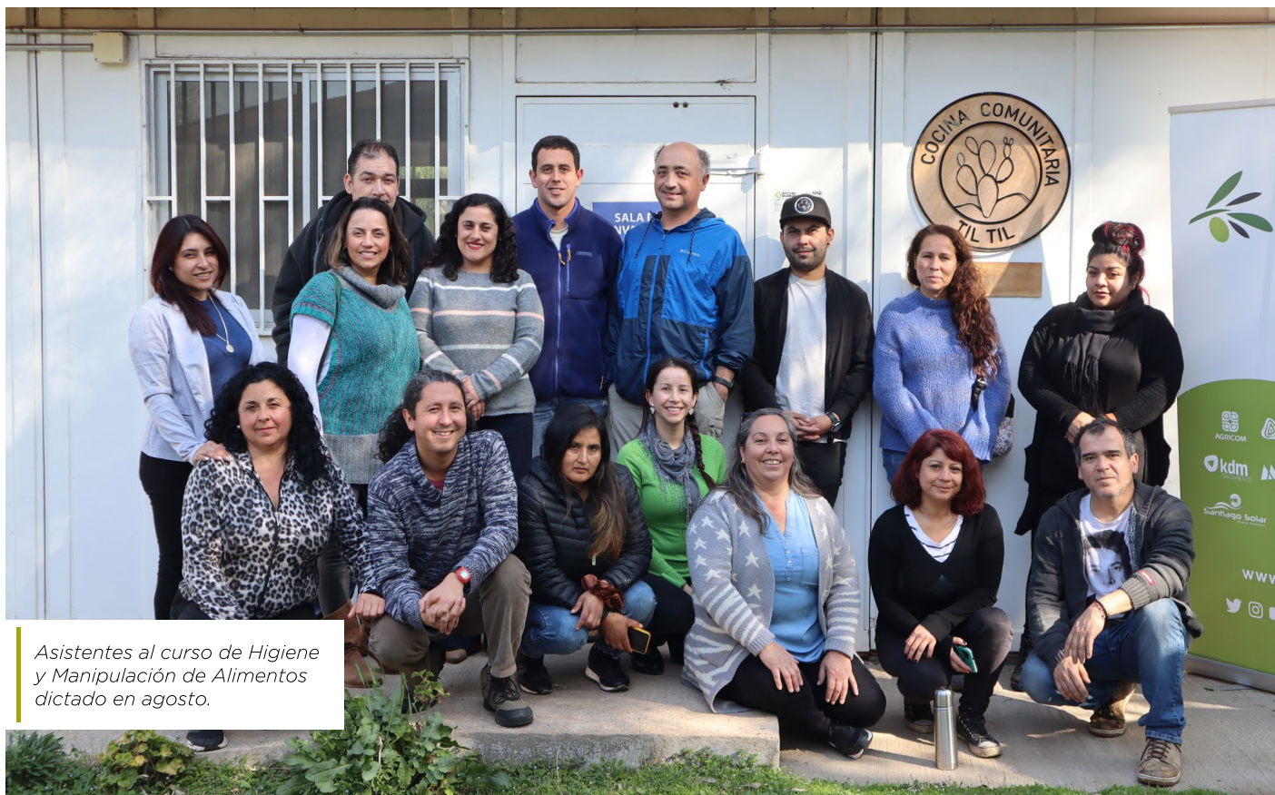
Asistentes al curso de Higiene y Manipulación de Alimentos dictado en agosto.

La disposición de la Cocina Comunitaria de Tilttil, se traduce en una gran oportunidad para los emprendedores del sector alimentos de la comuna, que se ven enfrentados a la imposibilidad de acceder a la resolución sanitaria, especialmente en las zonas rurales, dadas las exigencias sanitarias de acceso a agua potable y alcantarillado que son requeridas para este fin.