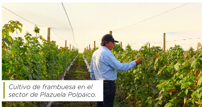
Cultivo de frambuesa en el sector de Plazuela Polpaico.

Este programa ha resultado ser una iniciativa pionera, por primera vez, se instalan huertos de frambuesa en la zona norte de la Región Metropolitana, con variedades especialmente adaptadas al exigente clima y suelo de Tiltil y Colina, desarrolladas por el equipo encabezado por la académica Marina Gambardella, académica de la UC.