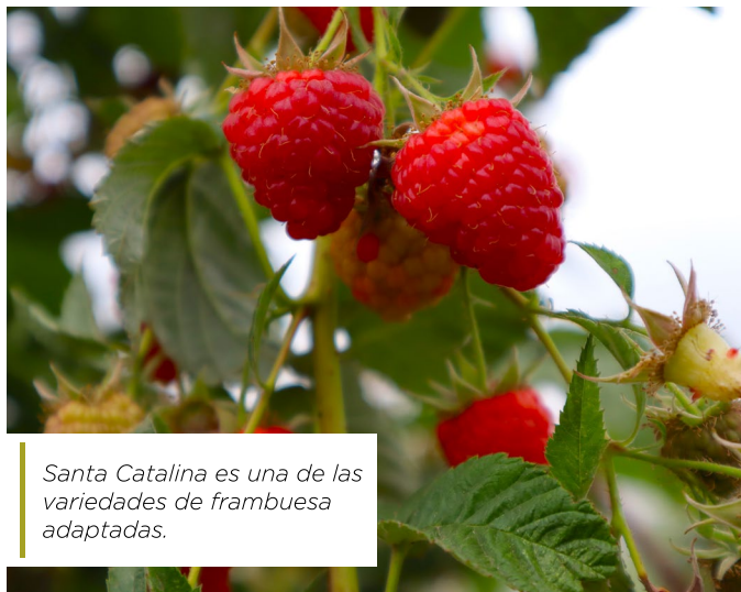
Santa Catalina es una de las variedades de frambuesa adaptadas.

El proyecto “Programa de Innovación Agrícola” para el Cultivo de Frambuesa” tiene como objetivo generar una nueva alternativa productiva en los territorios de Tiltil y Colina, a través de la implementación de huertos de frambuesas, con variedades de mayor resistencia a las condiciones climáticas e hídricas y tipo de suelo de la provincia.