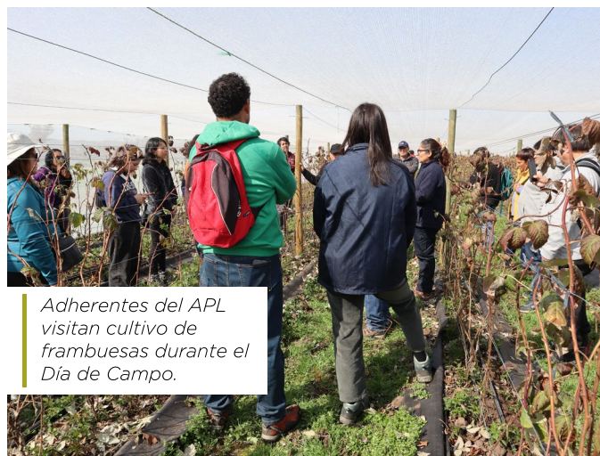
Adherentes del APL visitan cultivo de frambuesas durante el Día de Campo.

Durante 2024, la agricultura familiar campesina y la adaptación al cambio climático fueron un punto central en nuestro quehacer como Corporación. La forma en la que nos abocamos a la tarea de apoyar a la agricultura local, caracterizada en Tilttil por la producción de tuna y aceitunas, fue a través de la ejecución de un “Acuerdo de Producción Limpia (APL) de Gestión y Eficiencia Hídrica para la Producción Agrícola de Tilttil”, financiado por la Agencia de Sustentabilidad y Cambio Climático, con aportes del Gobierno Regional Metropolitano de Santiago, y copatrocinada por Pro Tilttil, que permitió la ejecución de $109,87 millones .