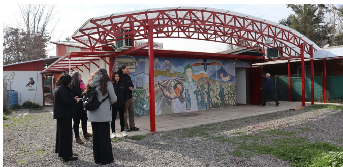
El Centro Cultural Raíces Propias cuenta con acceso universal.

Como fruto del Convenio de inversión Comunitaria firmado en enero de 2024 entre Codelco División Andina, Pro Tiltil y Centro Cultural Raíces Propias de Huertos Familiares, y que contó con la colaboración de la Corporación Cultural de Tiltil en la programación y ejecución de las actividades del plan, se realizó el programa cultural integral para la comuna de Tiltil, que además de garantizar la disposición de una oferta cultural a lo largo del año, favoreció el mejoramiento y equipamiento del Centro Cultural Raíces Propias de Huertos Familiares .