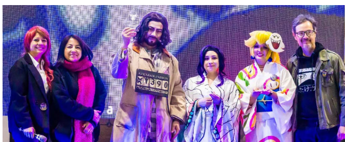
La Feria Cosplay concitó gran interés.