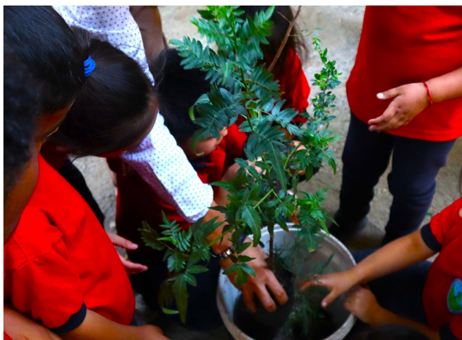
Actividad medioambiental en Escuela Santa Matilde.

El “Acuerdo de Producción Limpia Territorial para la Gestión Sustentable del Agua en la Comuna de Tiltil” tiene como objetivo desarrollar una estrategia público-privada que permita enfrentar los efectos del cambio climático en la comuna.