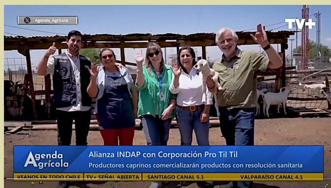
Agenda Agrícola realizó un reportaje al Programa de Apoyo para los Productores Caprinos.

También se debe destacar que durante este año se concretaron dos importantes hitos, que permitirán una comunicación más fluida con nuestras empresas socias, instituciones en alianza, nuestra comunidad y público en ge-