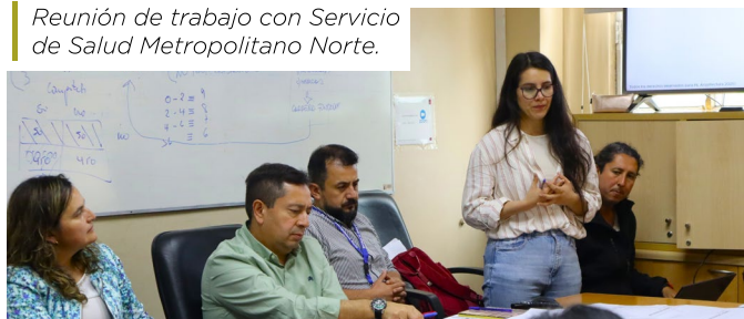
Reunión de trabajo con Servicio de Salud Metropolitano Norte.

Paralelamente, con aportes de nuestra empresa socia Codelco División Andina, se están realizando los diseños de las estaciones médico-rurales de Punta Peuco y Santa Matilde, así como también de la construcción o reconstrucción del liceo de Huertos Familiares y de las escuelas de Polpaico y Santa Matilde. En la ejecución de esta iniciativa la Corporación Pro Tilttil ha velado para que los diseños propuestos respondan a las necesidades de sus poblaciones beneficiarias en una alianza con la Municipalidad de Tilttil, que ha tenido como estrecho colaborador a la Dirección de Obras Municipal.