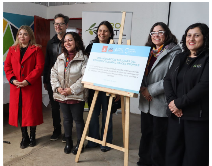
En agosto se inauguraron las obras de mejora en la infraestructura del Centro Cultural Raíces Propias.

Tal como se mencionó anteriormente, parte de los recursos de este programa cultural, permitió la compra e implementación de equipamiento para el Centro Cultural Raíces Propias, esto consistió en 3 equipos de aire acondicionado; compra de escenario modular y obras de mejora de infraestructura de acceso al Centro generando un acceso Universal e Inclusivo .