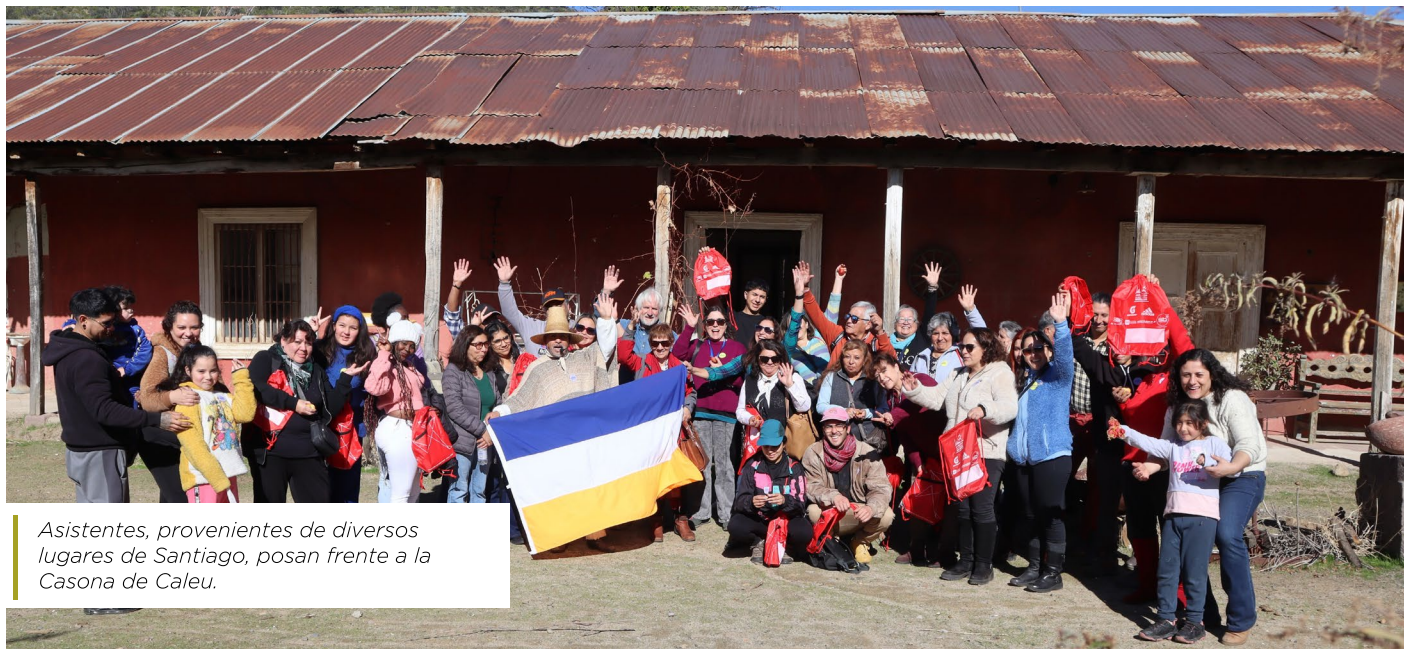
Asistentes, provenientes de diversos lugares de Santiago, posan frente a la Casona de Caleu.