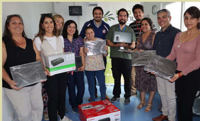
Ceremonia de entrega al Cesfam de Huertos Familiares.

Este proyecto consideró una inversión de $38,76 millones .