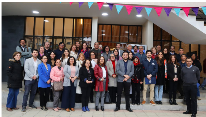
Encuentro del APL Territorial realizado en Tiltil.