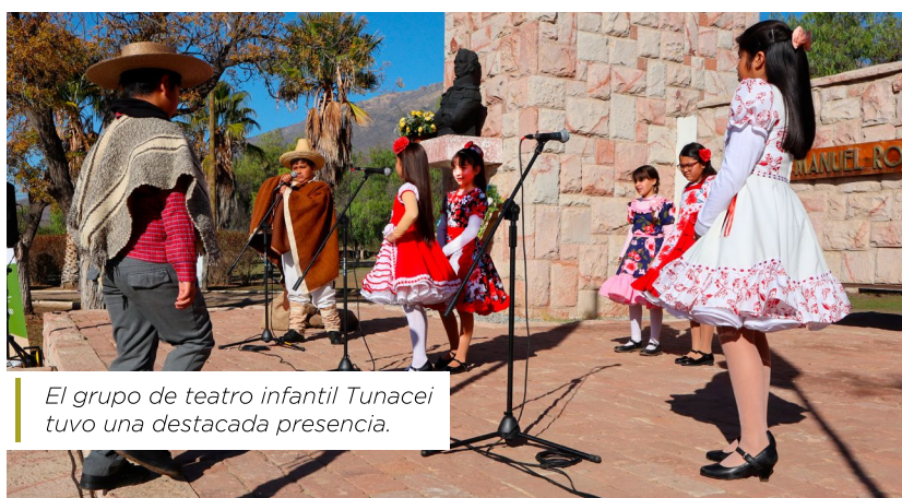
El grupo de teatro infantil Tunacei tuvo una destacada presencia.

El sábado 1º de junio se celebró, por tercer año consecutivo, el Día de los Patrimonios , una actividad que busca dar a conocer el rico acervo histórico de la comuna.