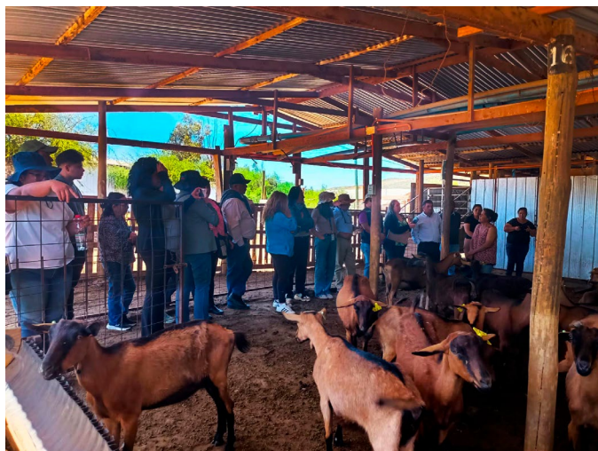
Crianceros realizaron una gira técnica a la Región de Coquimbo.

El Programa de Apoyo a Productores Caprinos de la comuna de Tilttil, realizado en alianza con el Instituto Nacional de Desarrollo Agropecuario de Chile (INDAP) , a través de su Agencia de Área Norte , busca la revalorización de un rubro histórico y tradicional de nuestra comuna, la producción de derivados de la leche de cabra, y al mismo tiempo favorecer el cumplimiento de estándares sanitarios que garanticen la seguridad alimentaria de los consumidores de los subproductos de la leche de cabra.