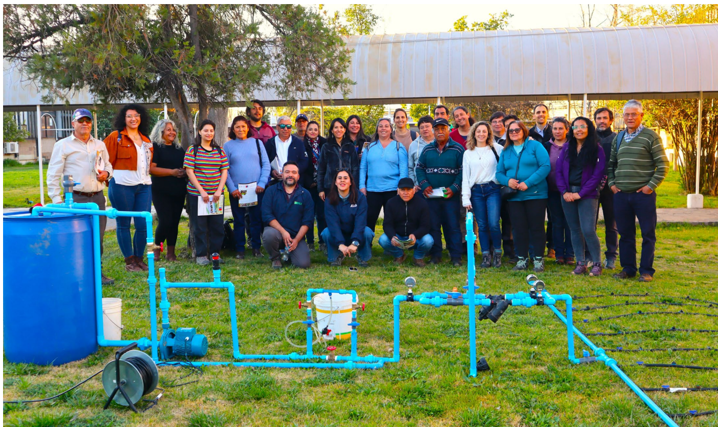
Adherentes del APL Agrícola visitaron INIA La Platina durante Día de Campo realizado en septiembre.