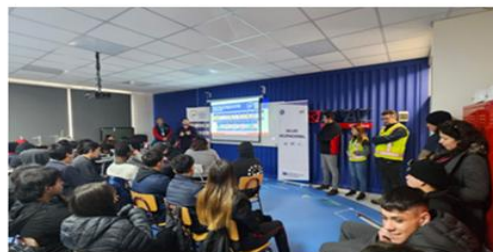
Empresas Locales, realizan charlas de Ergonomía en el manejo de Grúas, Sala Portuaria, INCO