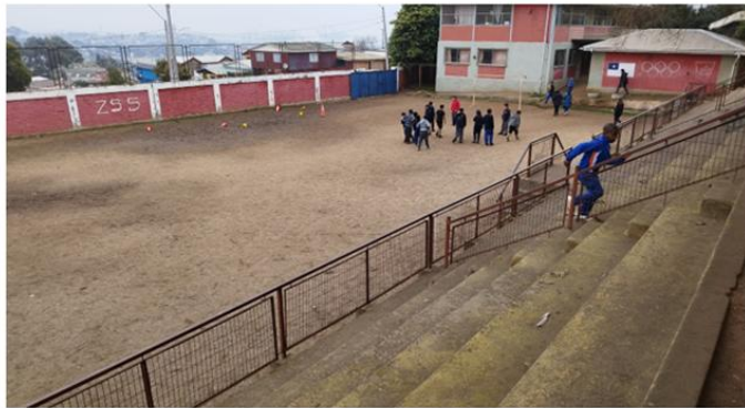
Proyecto de Mejoramiento Multicancha, Escuela Padre André Coindre.