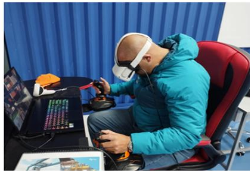
Instructor Grúa, conociendo Proyecto Sala Portuaria, INCO