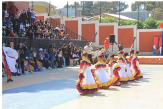
Fiesta Costumbrista, Escuela Padre André Coindre