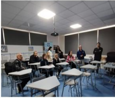
Delegación de la Escuela 4-001 de Mendoza, intercambio de experiencias educativas, Sala Portuario, INCO