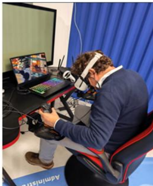
Docente CFT, aprendiendo del Proyecto Sala Portuaria, INCO