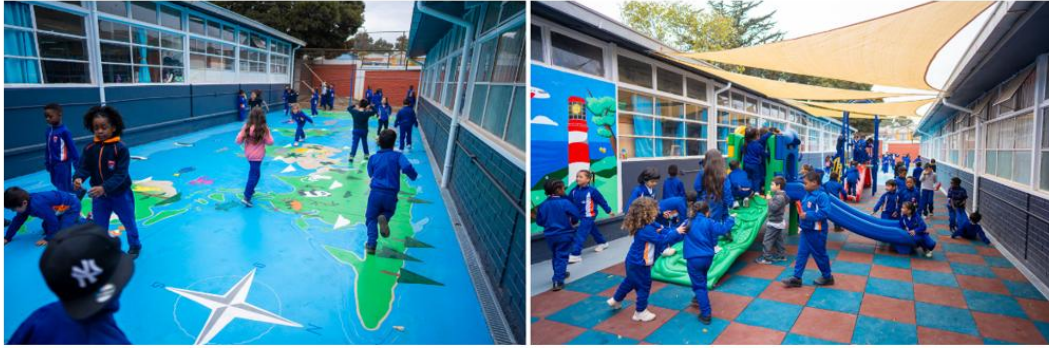
Proyecto de Mejoramiento, Patio Preescolar, Escuela Padre André Coindre. |