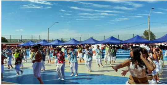
Aniversario, Escuela Padre André Coindre