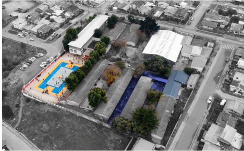
Zona demarcada destinada a la intervención del proyecto de mejoramiento.