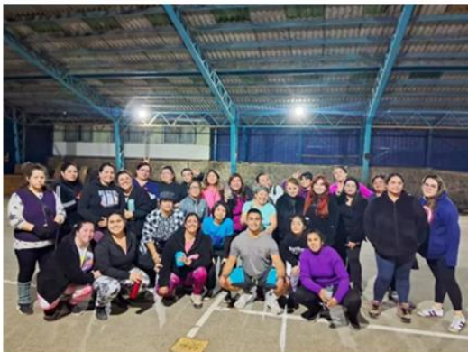
Zumba, Escuela Padre André Coindre