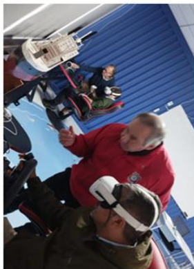
Docentes de Logística y Op. Portuarias se capacitan, Sala Portuaria, INCO