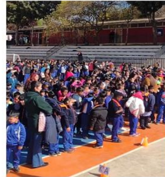
Actos Cívicos, Escuela Padre André Coindre