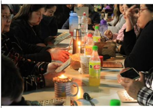
Bingo Familiar, Escuela Padre André Coindre

La ejecución de estos proyectos ha permitido a la Fundación CSAV consolidar capacidades técnicas y operativas para diseñar, desarrollar e implementar iniciativas orientadas al fortalecimiento del desarrollo comunitario y local, así como al desarrollo urbano y habitacional. Esta experiencia habilita a la institución no solo para intervenir en establecimientos educacionales, sino también para ampliar su accionar hacia otros espacios y actores comunitarios en futuras iniciativas y/o proyectos.