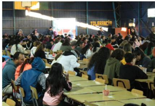
Bingo, Escuela Padre André Coindre