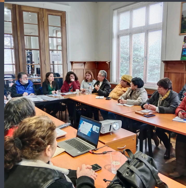
TRABAJO COLABORATIVO CON INSTITUCIONES PUBLICAS