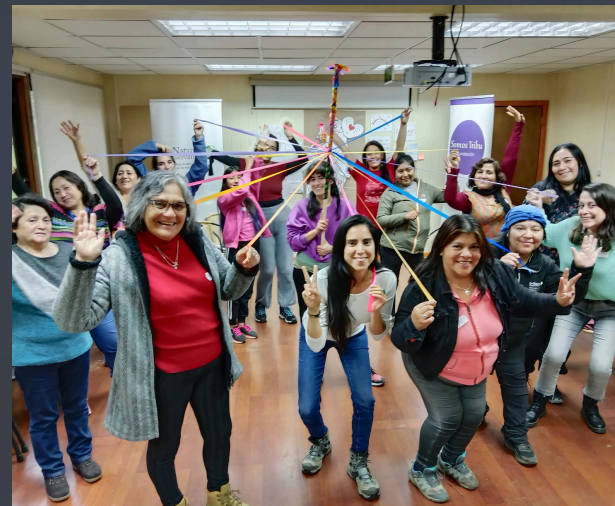
TALLERES EN COMUNAS

Durante el 2024, se llevaron a cabo de manera sistemática los talleres de empoderamiento femenino de Somos Tribu en las comunas de Corral, Mehuin y Valdivia, fortaleciendo la autonomía y participación activa de las mujeres en sus comunidades. Además, se realizaron consultorías y asesorías técnicas a la Mesa Regional de Mujeres de la Pesca Artesanal y Actividades Conexas de la Región de Los Ríos, fortaleciendo su capacidad de liderazgo y autonomía, y potenciando su rol en la protección y sostenibilidad de los ecosistemas marinos.