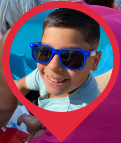
Casa hogar, Invitados 65 niños en Pirque / MEMORIA 2022