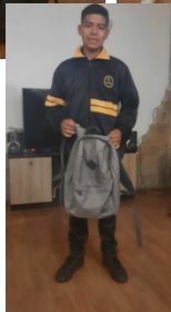
Niños casa hogar FLP.