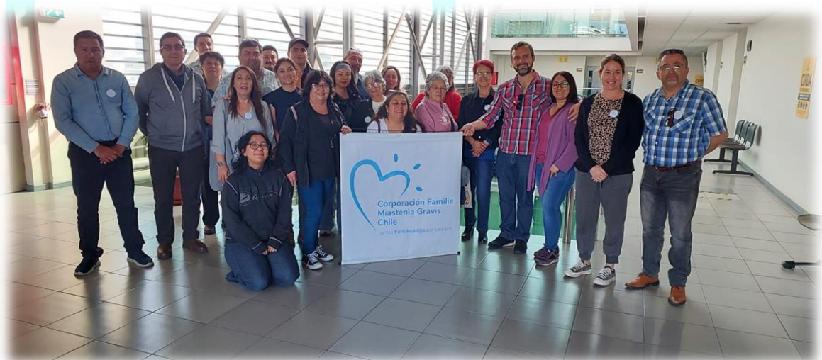
Juntos Fortalecid@s por siempre