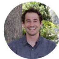
JOSÉ DE AMESTI