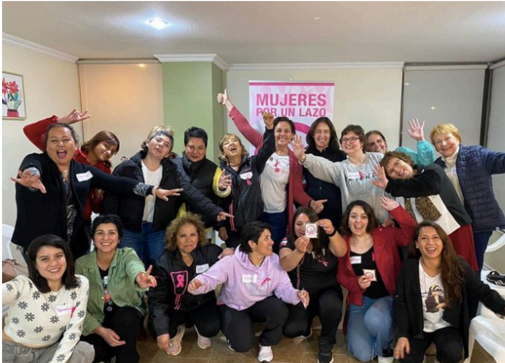
Esta imagen es de un encuentro de Mujeres por Un Lazo realizado en Viña del Mar.

Mes de conciencia del cáncer de mamas: se desarrollaron diferentes acciones de difusión como entrega de volantes, entrega de información en lugares públicos, publicación a través de redes sociales y