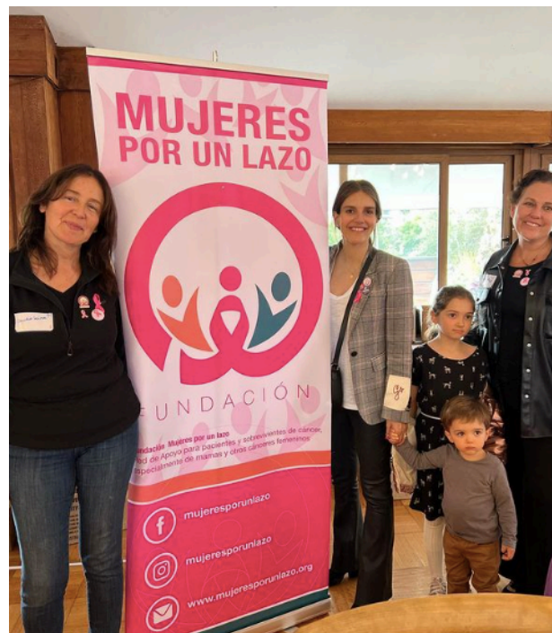
7-10-23 Primer Congreso de Mujeres con Cáncer de Mama organizado por Idolas y Falp en Club Palestino