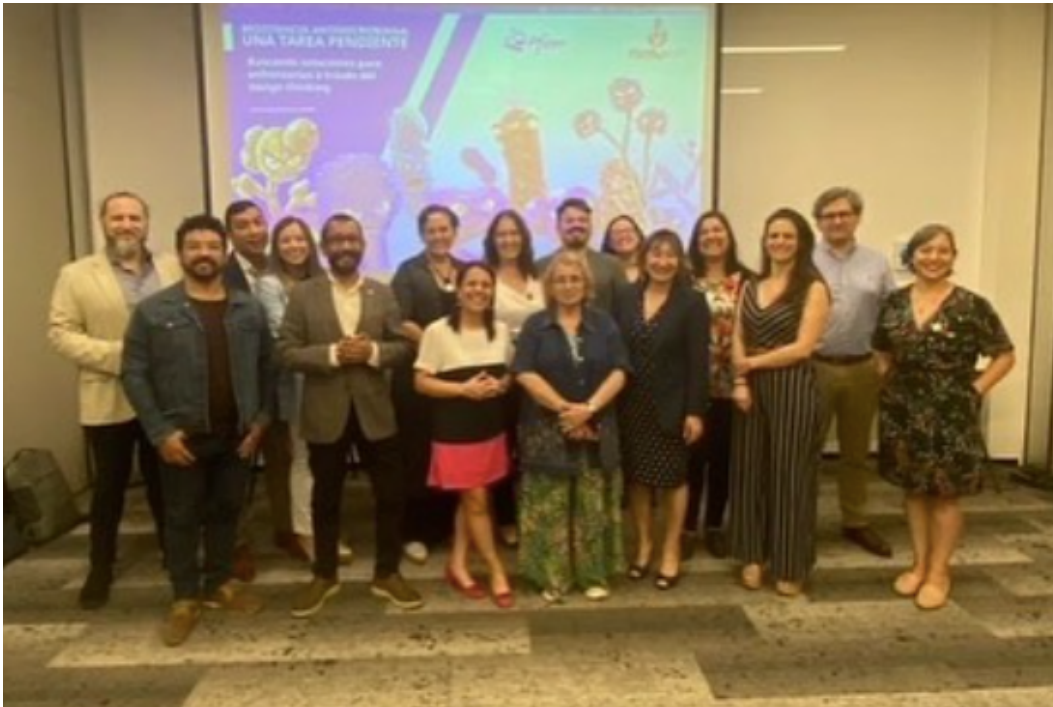
29-11-22 participación de Mujeres por un Lazo en actividad organizada por Área Médica y Patient Advocacy de Pfizer

Generación de vínculos externos: contacto con municipios, organizaciones de la sociedad civil, instituciones de gobierno y privados para crear entornos colaborativos: Municipalidad de Colina, Municipalidad de Lampa, Mi mamografía proyecto Fondecyt UC, Fundación Entretodas, Avon, Pfizer, Oncoguía dependiente de FALP.