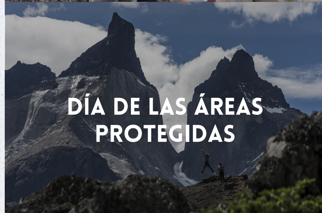
DÍA DE LAS ÁREAS PROTEGIDAS