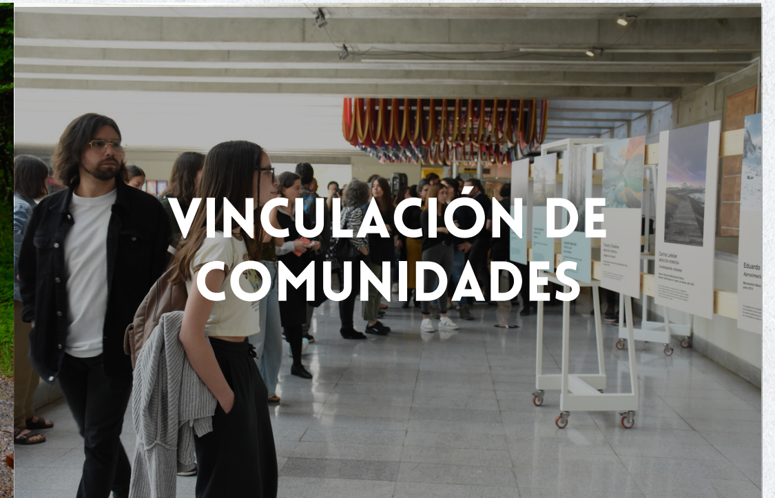
VINCULACIÓN DE COMUNIDADES