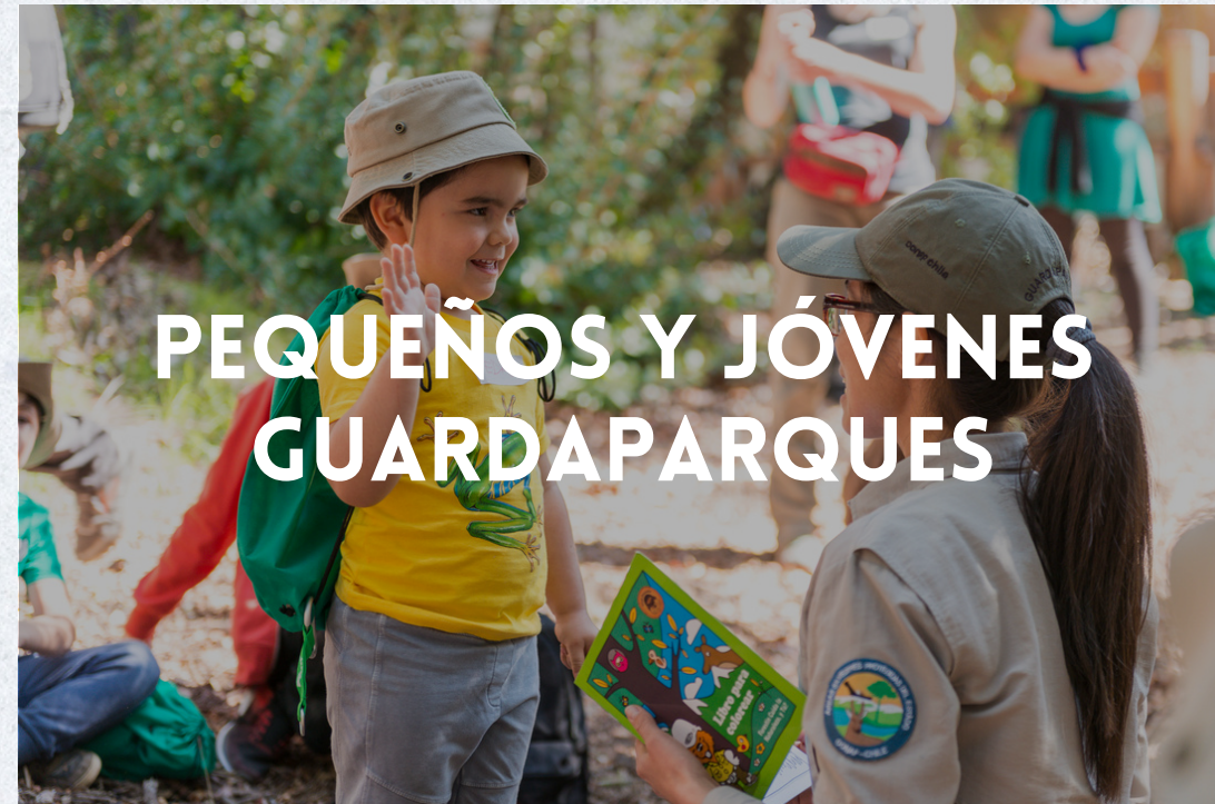
PEQUEÑOS Y JÓVENES GUARDAPARQUES