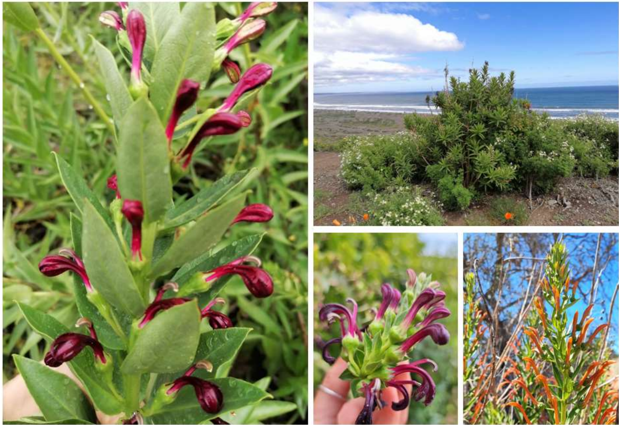
Registro fotográfico de la colecta de Lobelia excelsa y Lobelia polyphylla en sector Rocas de Santo Domingo.