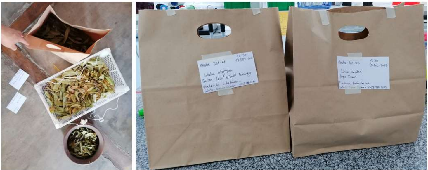
Registro fotográfico de la preparación de muestras para envío al laboratorio fitoquímica de la UNAB.