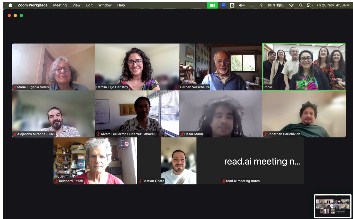
Fotografía Asamblea anual de socios 2025