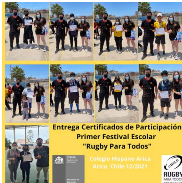
Entrega Certificados de Participación Primer Festival Escolar "Rugby Para Todos"

Colegio Hispano Arica Arica, Chile 12/2021