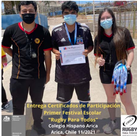
Entrega Certificados de Participación Primer Festival Escolar "Rugby Para Todos" Colegio Hispano Arica Arica, Chile 11/2021