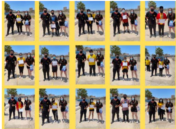
Entrega Certificados de Participación Primer Festival Escolar "Rugby Para Todos" Colegio Hispano Arica Arica, Chile 12/2021