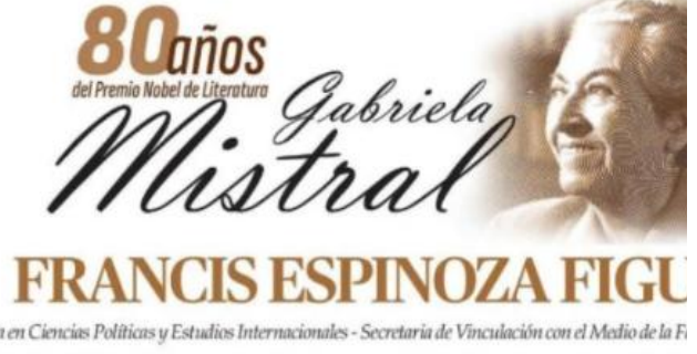
Doctora en Ciencias Políticas y Estudios Internacionales - Secretaria de Vinculación con el Medio de la F

¿Qué rol crees que debería jugar la literatura en la formación de los estudiantes de hoy, especialmente en contextos adversos como el nuestro? Gabriela Mistral ejerció la diplomacia desde una posición singular: no como política profesional, sino como poeta, educadora y mujer latinoamericana en un mundo profundamente masculino. Desde su mirada como doctora en Ciencias Políticas y Estudios Internacionales, ¿cómo evalúa hoy el ejercicio diplomático mistralino y su vigencia en las relaciones internacionales contemporáneas? Gabriela Mistral representó la alta diplomacia pública, pues ejerció distintos cargos, y muchos análisis señalan que ella se convirtió en "la segunda cultura" de nuestro país en el extranjero. Su carrera consular comenzó en Italia (Napoli) en 1912, específicamente el 15 de abril llegó un comunicado que la nombra Cónsul Particular a Elección, pero desgraciadamente no pudo asumir debido a la presencia de un gobierno fascista, dado que ella se declaró antifascista. Asimismo, Benito Mussolini no aceptó diplomáticos que fueran mujeres. Sin embargo, fue la primera mujer en desempeñar un cargo diplomático.