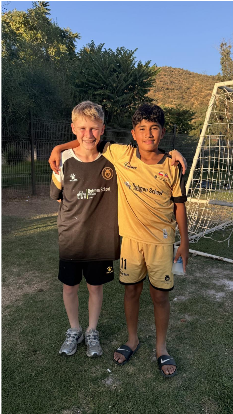
Lazos de amistad entre delegaciones - intercambio cultural espontaneo Chile-EE.UU.