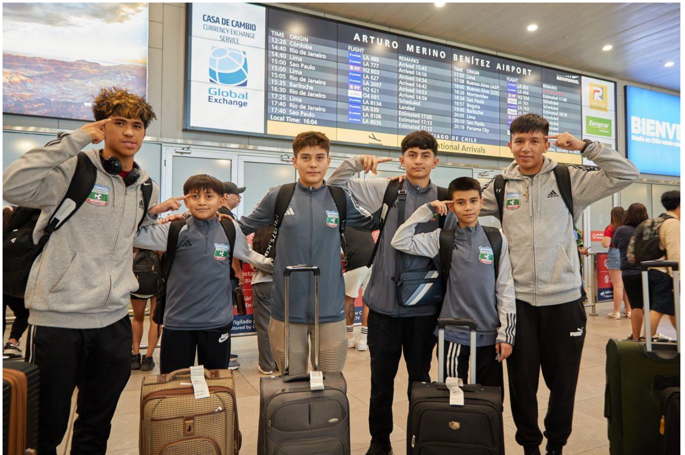
Llegada de la delegación al Aeropuerto Arturo Merino Benítez - Intercambio Little Giants, enero 2026

Segunda visita de Little Giants a Chile, enero 2026. Mayor escala: más participantes, hospedaje en hotel, visita al Estadio Monumental de Colo-Colo, torneo FA Cup Chile, actividades de esparcimiento y convivencia intercultural. Todo gratuito para los niños de Curacaví.