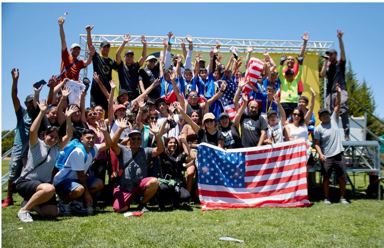
Foto grupal final con ambas delegaciones, familias y cuerpos técnicos - Curacaví 2026