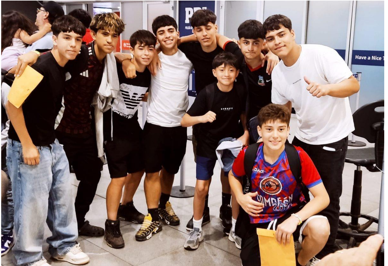
Jugadores de la Academia Golden en aeropuerto internacional - proyección hacia Delaware, EE.UU., mayo 2026