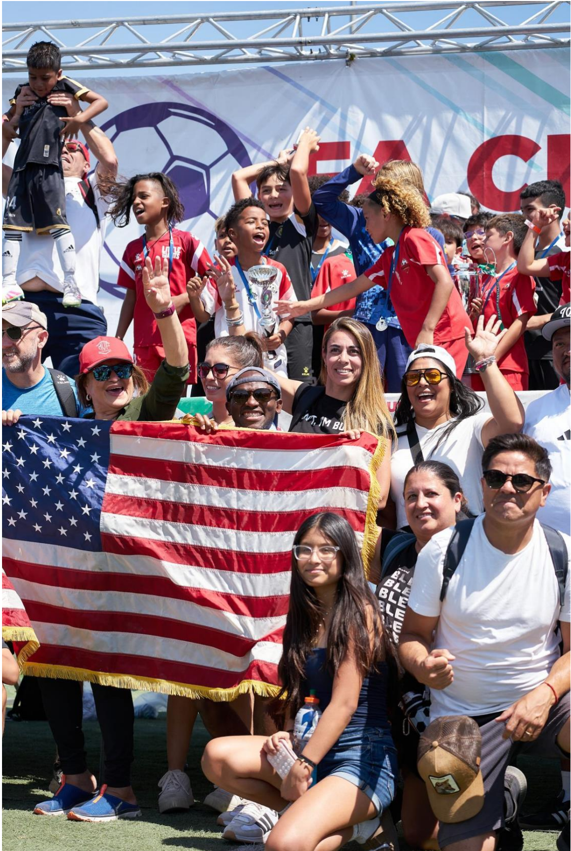
Familias chilenas y americanas celebrando juntas - FA Cup Chile 2026