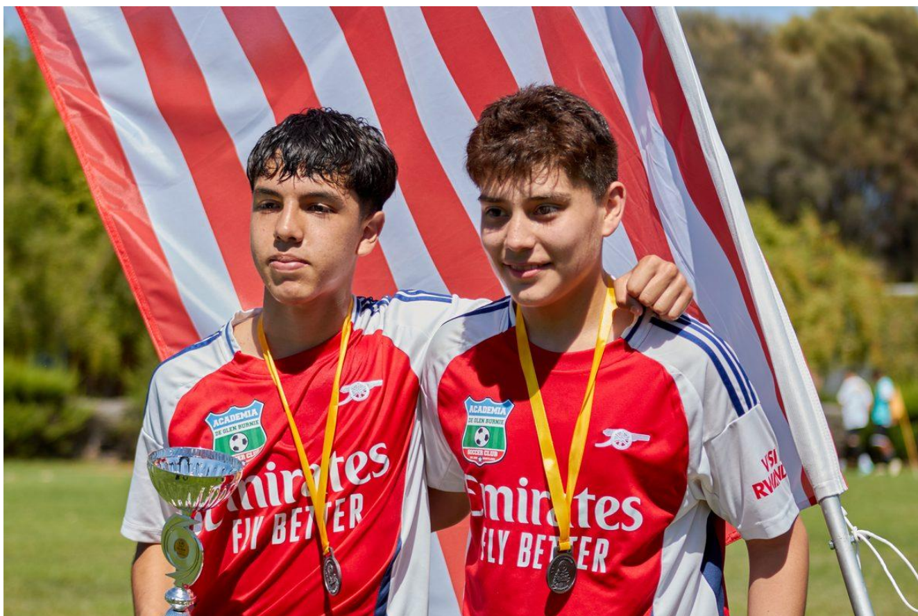
Niños de Glen Burnie con trofeos y medallas - FA Cup Chile 2026