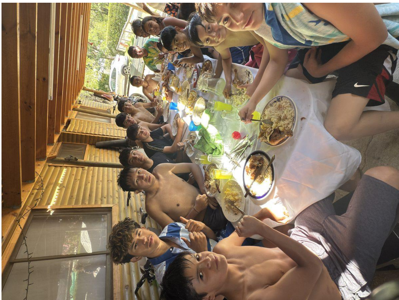
Cena compartida en casa de apoderados - Hospedaje familiar de la delegación Glen Burnie, Curacaví 2025