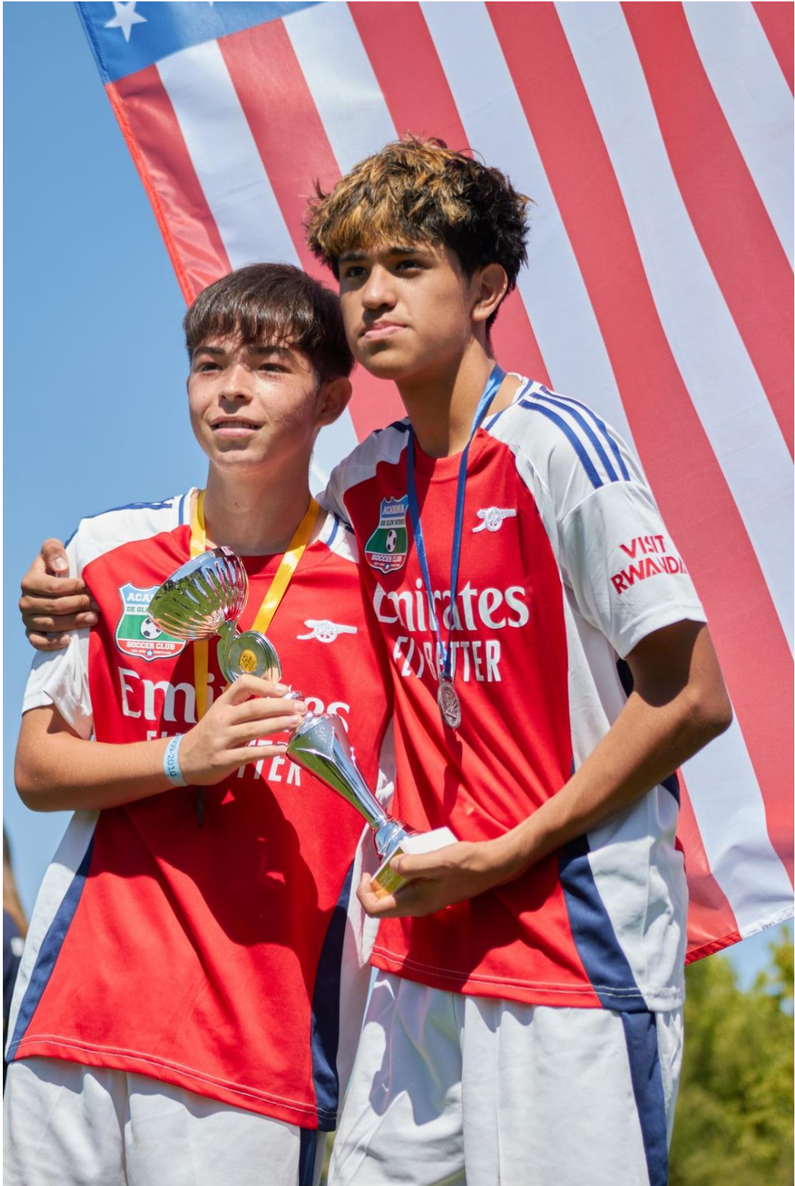
Premiación individual - FA Cup Chile, intercambio Little Giants 2026