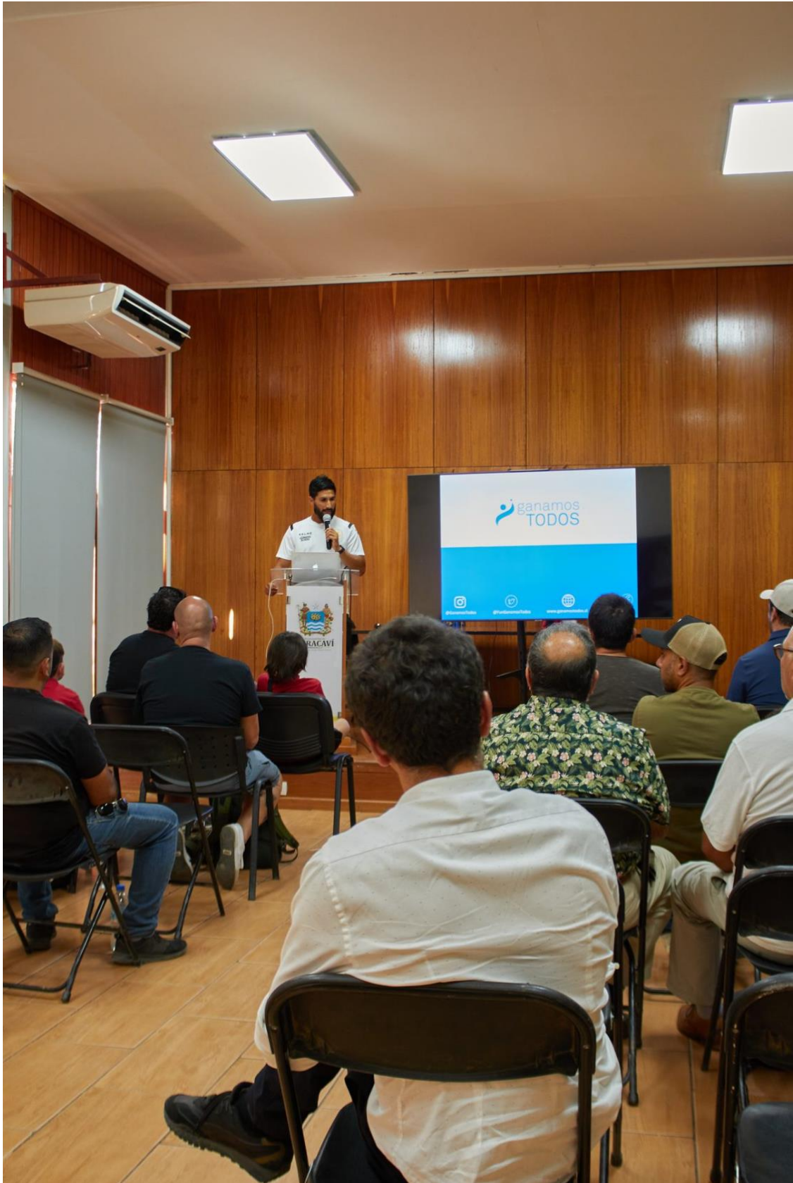
Presentación ante autoridades y comunidad de Curacaví - Sala Municipal