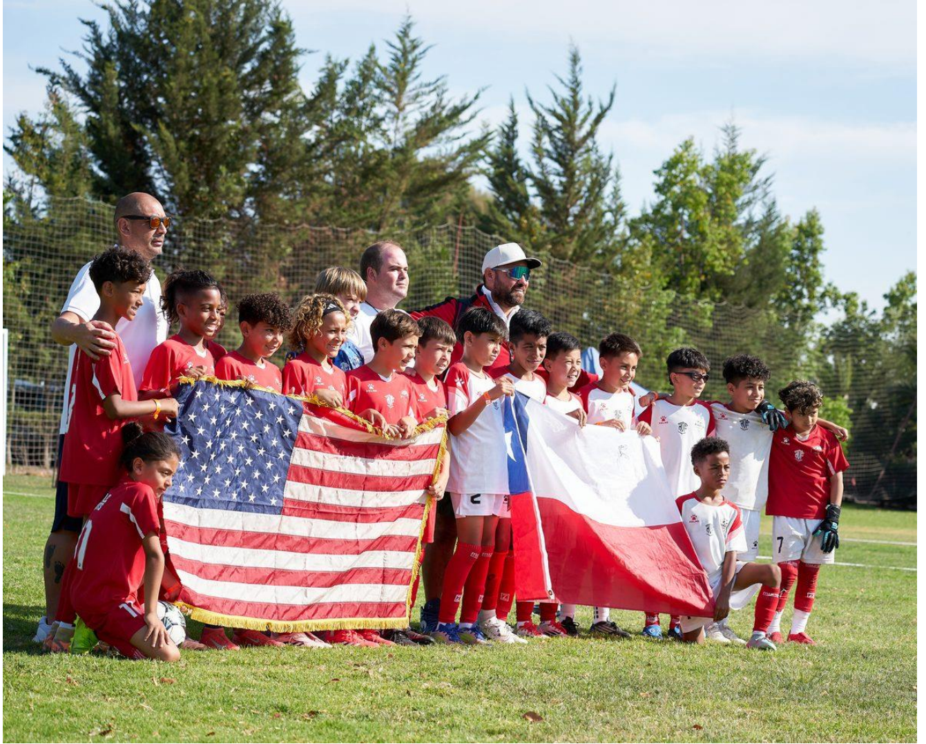
Delegaciones Chile y EE.UU. juntas con sus banderas - FA Cup Chile, Malloco 2026