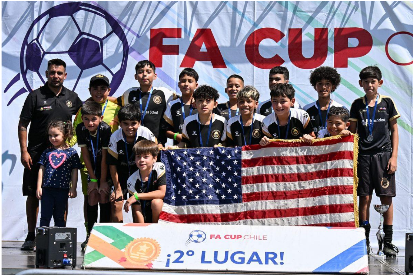
Academia Golden - 2º lugar FA Cup Chile 2026 con la delegación americana