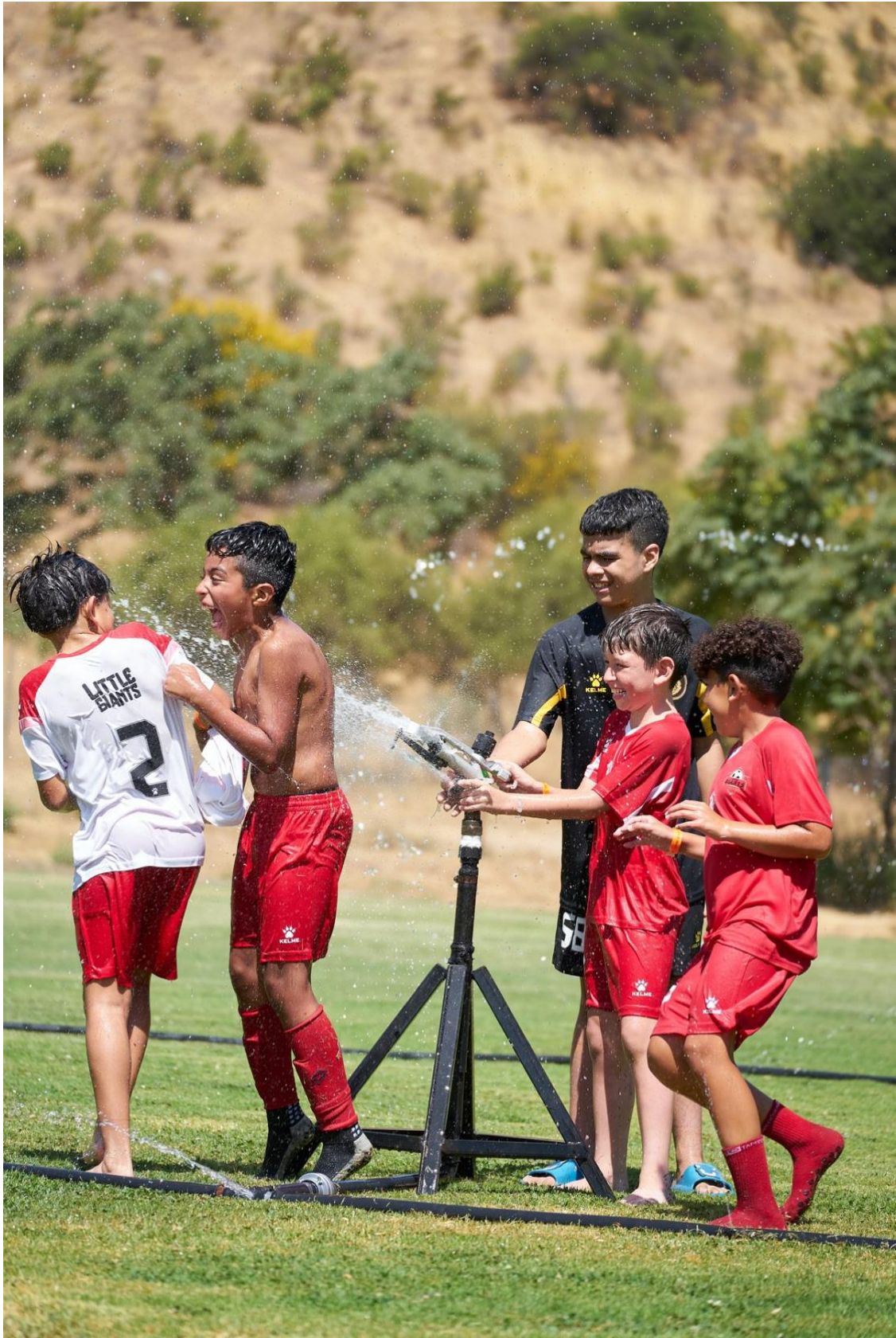
Niños Little Giants y Golden jugando con agua al final del día - convivencia espontanea 2026