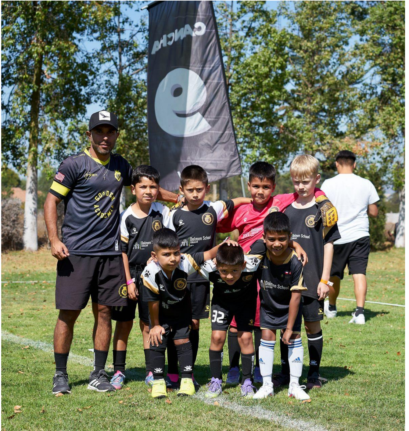
Categoría infantil Academia Golden con niños americanos integrados - torneo 2026