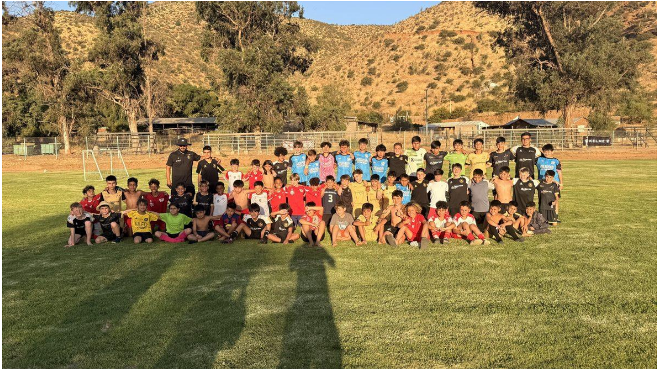
Foto grupal de ambas delegaciones al final de la jornada de entrenamiento - Curacaví 2025

Primera visita de la organización Little Giants de Washington D.C. a Curacaví en 2025. Jornadas deportivas de día completo, clínicas técnicas, torneo FA Cup Chile en Malloco y actividades de esparcimiento compartidas. Participación 100% gratuita.