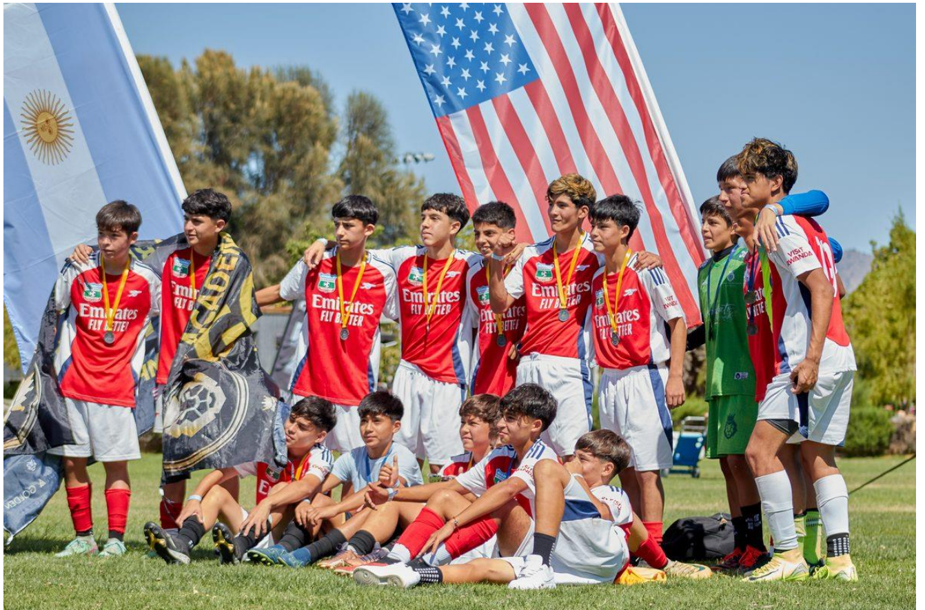
Equipos con medallas y banderas - Premiación FA Cup Chile 2026