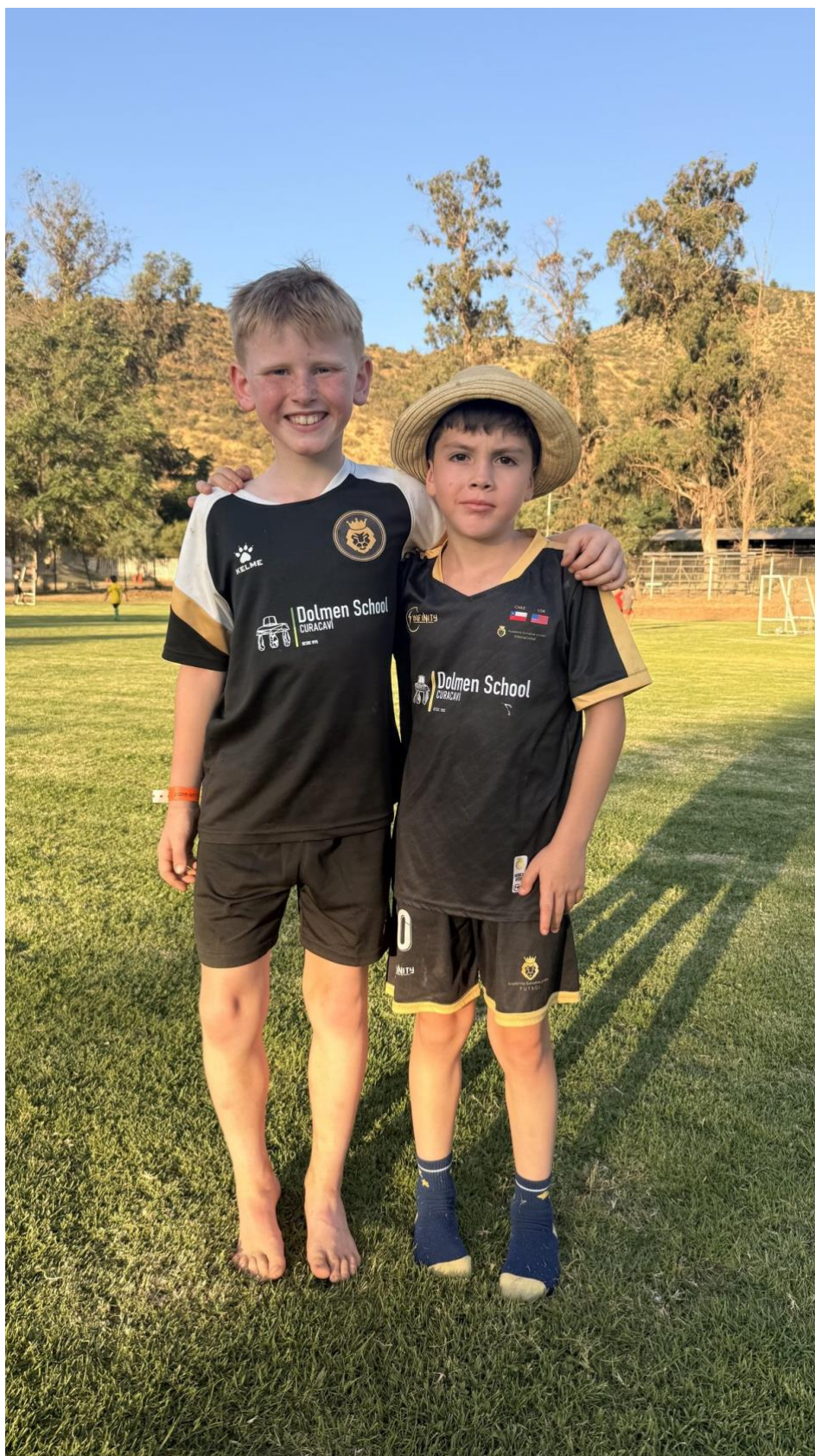
Niño americano y niño chileno de la Academia Golden, al cierre del día - Curacaví 2025