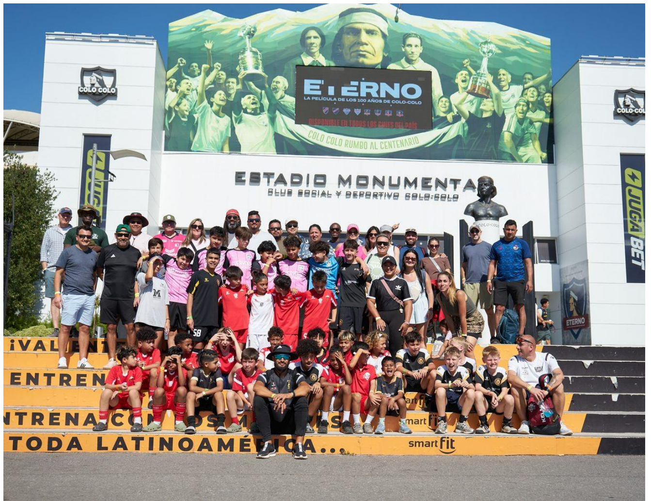
Visita al Estadio Monumental de Colo-Colo - actividad gestionada por la Fundación para la delegación americana 2026