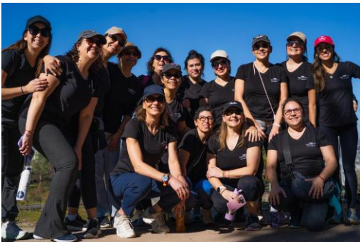
Caminata grupal 1° Programa YOU CAN FLY, marzo 2025