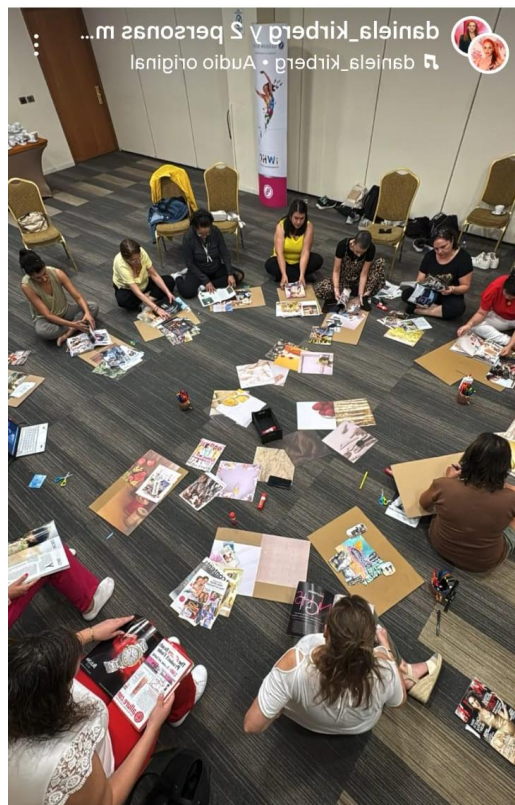
Taller motivacional 1° Programa, marzo 2025