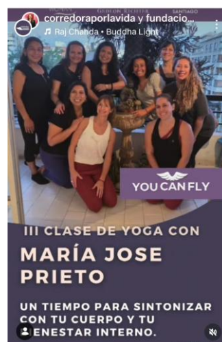
Encuentro 2° Programa, diciembre 2025