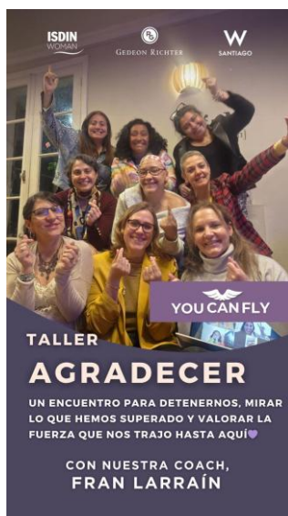
Taller motivacional 2° Programa, octubre 2025