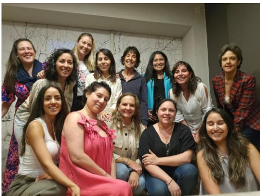
Taller motivacional 3° Programa, marzo 2026