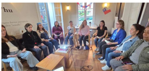
2° Programa YOU CAN FLY — sesión grupal