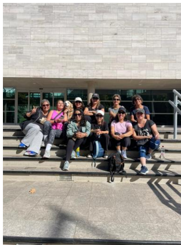
Sesión 3° Programa, marzo 2026