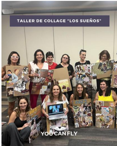
Taller motivacional híbrido — 1° Programa