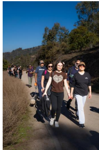
Participantes y familias en la Gran Caminata de Cierre