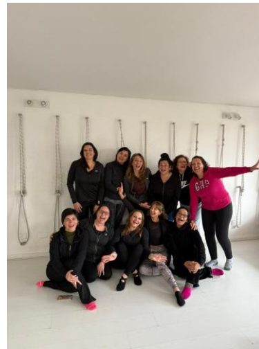
Participantes y equipo YOU CAN FLY en la sesión inaugural