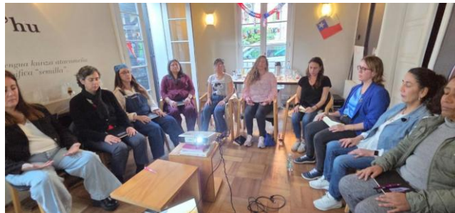
Caminata mensual 2° Programa, octubre 2025