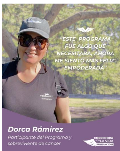
Preparación del 3° Programa YOU CAN FLY, febrero 2026