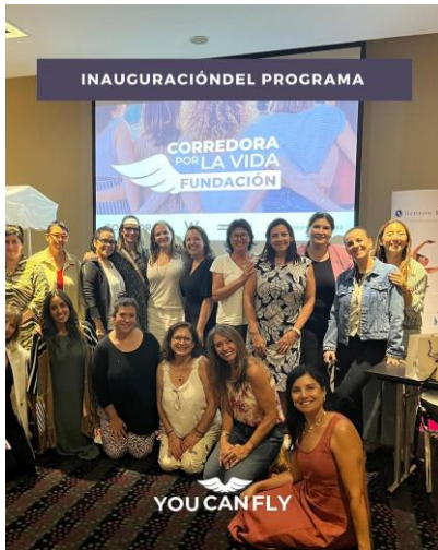
Inauguración 1° Programa — W Hotel, 11 de marzo 2025