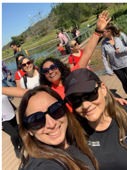
Clase de yoga — YOU CAN FLY, 2° Programa