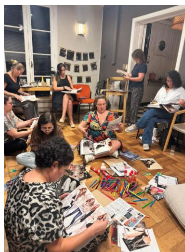
3° Programa en curso — marzo 2026