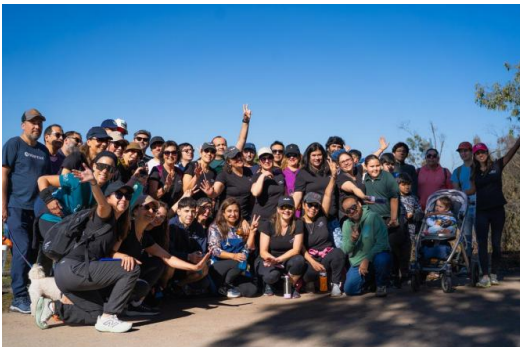
Gran Caminata Final Familiar — cierre 1° Programa YOU CAN FLY