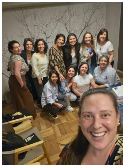
Taller 3° Programa, abril 2026