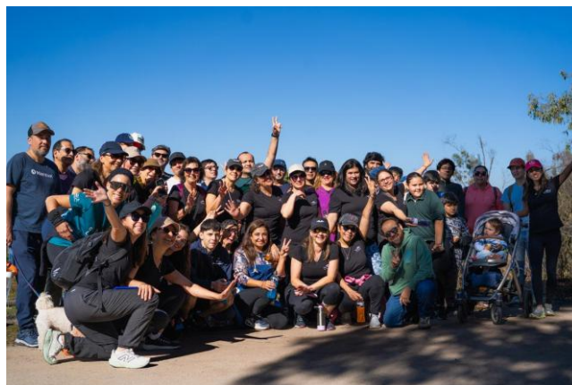
Caminata grupal — 1° Programa YOU CAN FLY