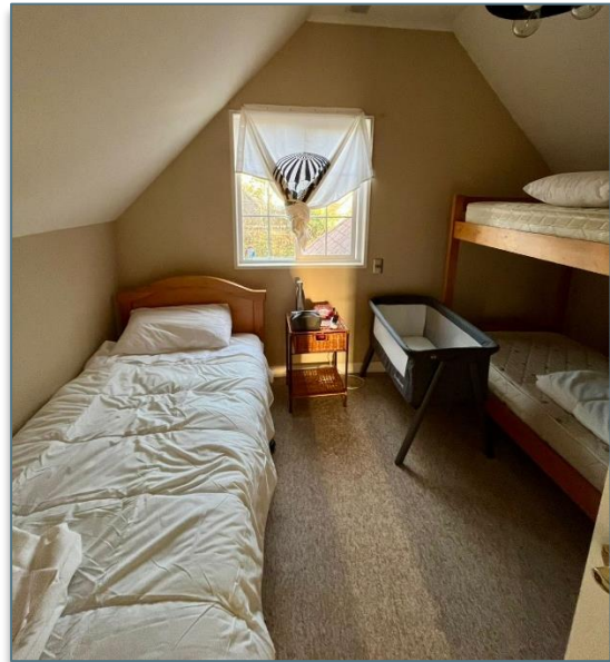
HABITACIONES Y SALA ESTAR MAMAS E HIJOS