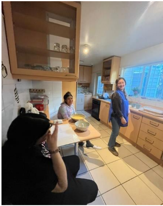
Beneficiarias en taller de cocina dado por una Voluntaria