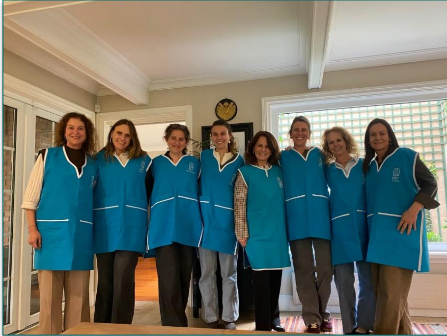
Capacitación fundadoras. Diciembre 2025.